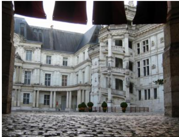
La famosa escalera exterior del castillo de Blois

Si después de los anteriores aún nos quedan ganas de más: Blois, Saumur, Angers o el de Chinon nos dejarán más que satisfechos. De los cuatro, los tres últimos son fundamentalmente espectaculares castillos medievales.