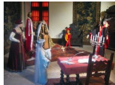
Escenas de la Bella Durmiente en el Castillo de Ussé

Si tras unas cuantas visitas a los castillos estamos ya un poco hartos de pagar entrada, un detalle que conviene tener presente es que muchos de ellos no es posible “verlos por fuera” sin pagar, pues se encuentran situados en recintos rodeados de prados, bosques o jardines. Chenonceau o Azay le Rideau serían claros ejemplos de esa situación.