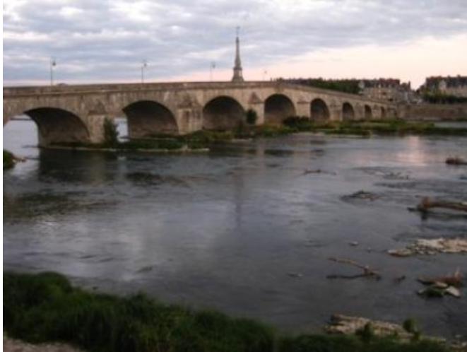
El Loira a su paso por Blois

El auge de los castillos-palacio del Loira tuvo lugar en los siglos XV y XVI, especialmente al calor de la corte del Rey Francisco I y su espectacular “pabellón de caza” de Chambord, seguramente el más grande y más espectacular de todos.