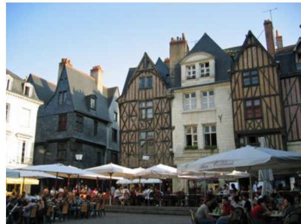
Tours - La place Plumereau

Para terminar este apartado, diremos que la estratégica situación de los castillos facilita la visita en uno o más viajes.