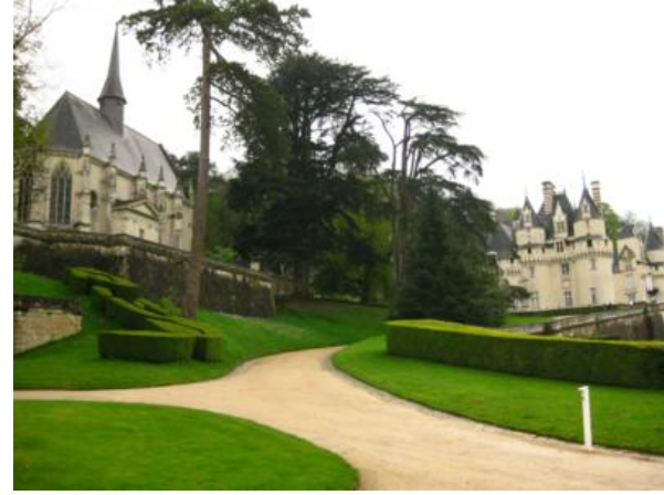
Ussé y sus jardines

Si después de los anteriores aún nos quedan ganas de más: Blois, Saumur, Angers o el de Chinon nos dejarán más que satisfechos. De los cuatro, los tres últimos son fundamentalmente espectaculares castillos medievales.