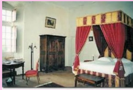
Cama con dosel... ¡pero con servicios modernos!

www.francisco-colet-viajesycaravanning.com contacto@francisco-colet-viajesycaravanning.com