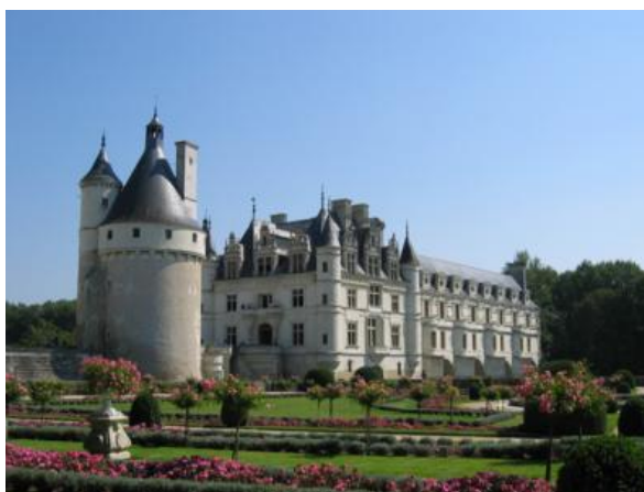
Chenonceau rodeado de jardines

Si tras unas cuantas visitas a los castillos estamos ya un poco hartos de pagar entrada, un detalle que conviene tener presente es que muchos de ellos no es posible “verlos por fuera” sin pagar, pues se encuentran situados en recintos rodeados de prados, bosques o jardines. Chenonceau o Azay le Rideau serían claros ejemplos de esa situación.