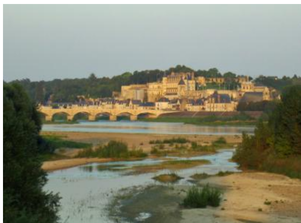
Amboise y el Loira

Los que no hay que perderse bajo ningún concepto -“les incontournables” como dicen los franceses- son: Chambord, Chenonceau, Amboise, Azay-le-Rideau, Villandry, Ussé o la abadía de Fontevraud. Especialmente los dos primeros, Chambord y Chenonceau, son visita obligada. El primero por su majestuosidad y su famosa escalera helicoidal (los que suben no se cruzan con los que bajan) atribuida a Leonardo da Vinci y el de Chenonceau por su curiosa arquitectura, construido a modo de puente sobre el río Cher.