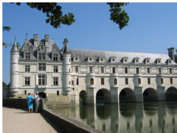
Chenonceau edificado sobre el río Cher

Todos tienen buenas razones para la visita, aparte de su belleza: Amboise por su imponente castillo real y los espectáculos veraniegos; Azay le Rideau por su ubicación en medio de un lago; Villandry, por sus magníficos