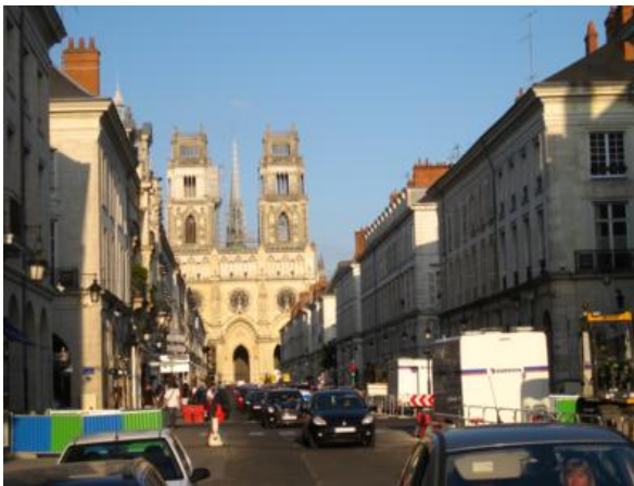
Orleáns y su catedral

Tampoco faltan localidades medievales preciosas: Loches, Montrésor, Chinon o Amboise os encantarán. Y las ciudades de Orleáns, Tours o Angers también tienen su puntito, con edificios de entramado de madera.