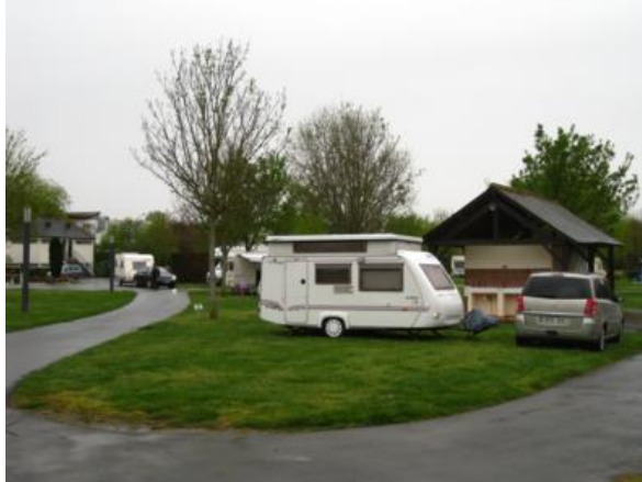
En el camping municipal de Chinon

Atención, los horarios de recepción de muchos camping franceses pueden ser peculiares, especialmente por cerrar pronto. Recomendamos contactar previamente con ellos, para no llevarnos sorpresas desagradables al llegar.