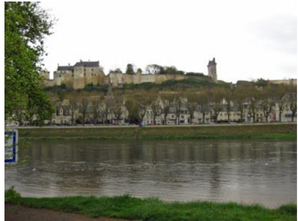
Chinon y su castillo desde el camping municipal

Por supuesto los castillos y edificios interesantes no terminan aquí. La lista es muy, muy larga, destacando “El Clos Lucé” en Amboise -donde falleció Leonardo da Vinci- o la “Pagode de Chanteloup” seguro que harán las delicias de muchos.