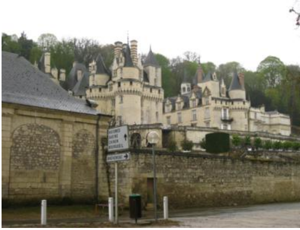
El castillo de Ussé

jardines ornamentales; Ussé por ser considerado “el Castillo de la Bella Durmiente” y estar decorado con escenas del cuento y, por último, la impresionante Abadía de Fontevraud, que alberga las tumbas del rey inglés Ricardo “Corazón de León” y de su madre, Leonor de Aquitania.