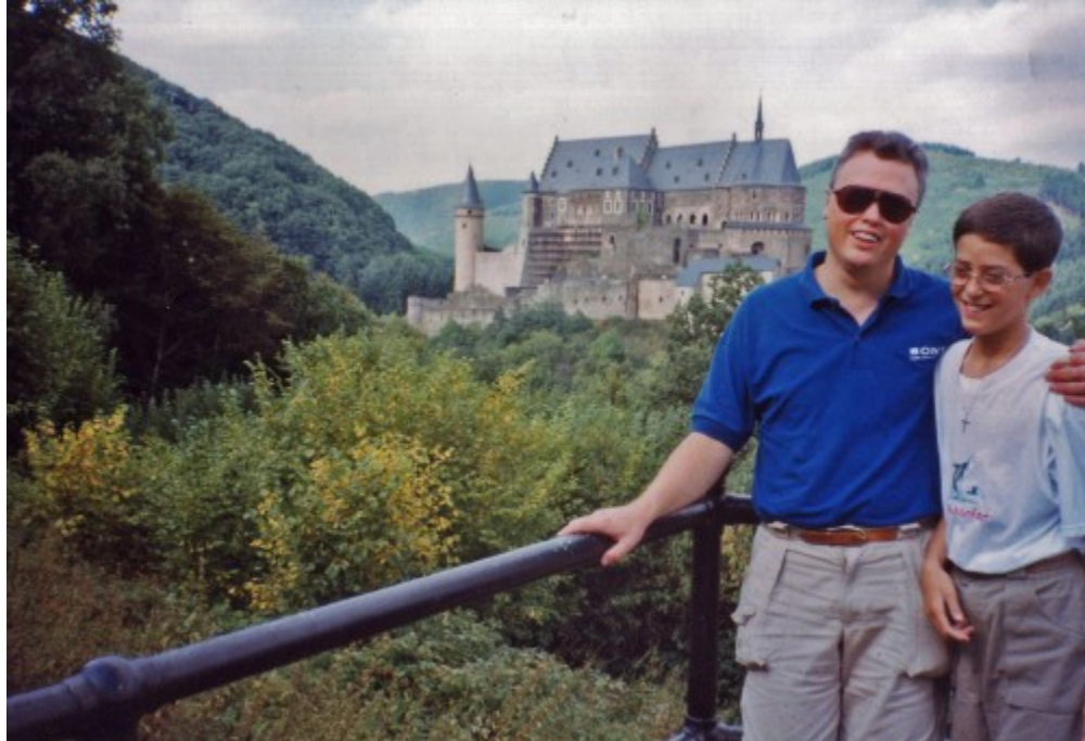
Junto al Castillo de Vianden

A lo largo de la geografía luxemburguesa encontraremos numerosos castillos, pero ninguno como el de Vianden. También paramos brevemente en Diekirch . No es un pueblo particularmente interesante, pero tiene un agradable centro peatonal y una iglesia con bastantes siglos a cuestas.