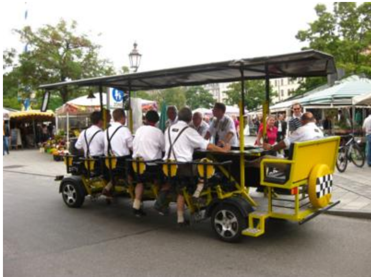
Munich "respira" cerveza. Si bebesss... ¡pedalea!

Aunque la Oktoberfest ya estaba inaugurada, al ser sábado y coincidir con el primer día de fiesta, optamos por dedicar la tarde a recorrer Munich y dejar la Oktoberfest para el día siguiente, pues si la fiesta es importante, la ciudad también.