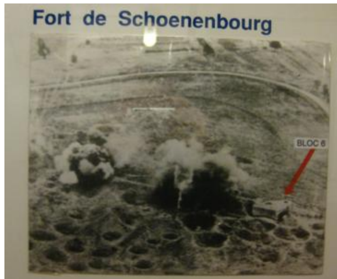
Le dieron "cera" de la buena...

A través de larguísimos túneles, se recorren varias torretas de tiro, almacenes de munición, la zona de cuartel: dormitorios, cocinas, etc. así como otras dependencias. La visita es muy interesante para quien aprecie la historia de la Segunda Guerra Mundial. El fuerte nunca fue tomado al asalto y sólo se rindió tras el armisticio francés, en junio de 1940. Más información en www.lignemaginot.com/index10.htm