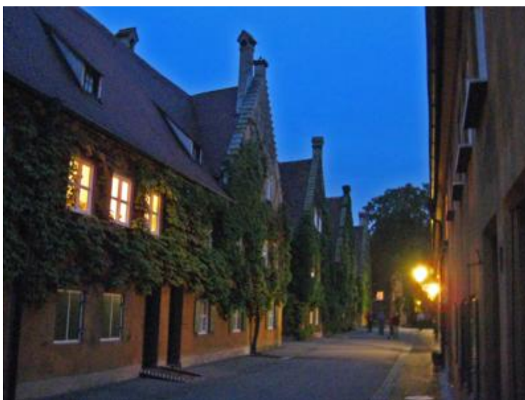
Augsburg. El Fuggerei

El otro gran punto de interés de Augsburg es el “ Fuggerei ”, el barrio de casitas para gente pobre, fundada por la familia Fugger en el siglo XV y que pasa por haber sido la primera ONG de la historia. En la actualidad es un conjunto de casas y callecitas muy tranquilas, a las cuales se accede a través de una arcada porticada. A las ocho cierran la puerta, así que hay que visitar el Fuggerei antes de esa hora.