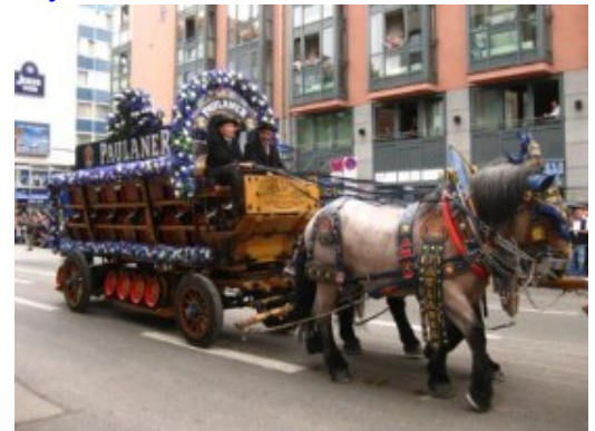
El desfile inaugural de carrozas