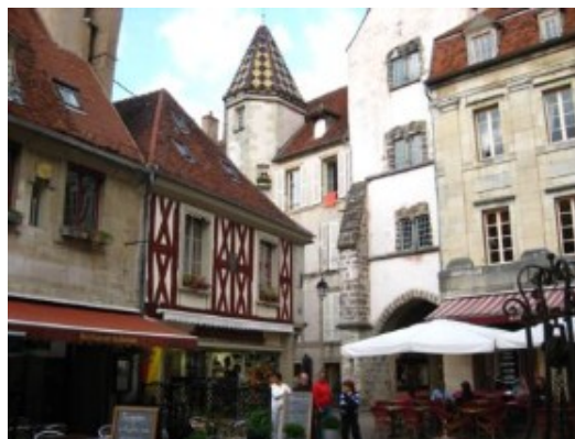
Sémur en Auxois

Terminamos el día en la bonita ciudad medieval de Sémur en Auxois , con su muralla, sus torres medievales y sus casas de entramado. De regreso al camping, nos fuimos al pueblo vecino en busca del amigo de la furgoneta de pizzas...que resultó ser un aficionado a la cría de caballos de carreras, algunos de los cuales habían ganado varios premios. ¡Hay que ver lo que dan de sí las pizzas!.