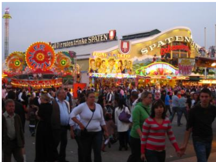
La Oktoberfest de Munich

Y llegó la hora de pisar la Oktoberfest. A media tarde cogimos el metro en Marienplatz y en sólo dos paradas -líneas U4 y U5- estábamos en Theresienwiese, el recinto ferial. La salida del metro desemboca directamente en la feria, que estaba literalmente abarrotada de gente.