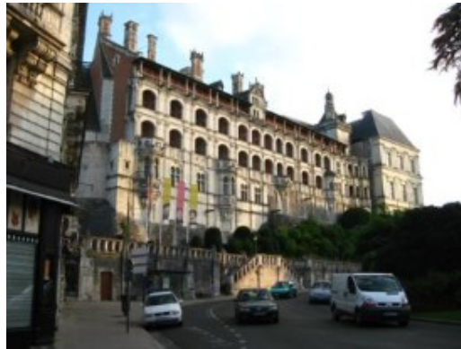
Blois, la fachada posterior del castillo

Aunque era domingo y sabíamos que la ciudad estaría casi “muerta”, su castillo y sus calles medievales eran un atractivo más que suficiente para terminar la jornada dando un paseo por Blois. Y así lo hicimos. Y es que muchas veces los domingos plantean serios problemas. Pincha aquí para saber un poco más de “cómo manejar” los domingos y días festivos para que no nos hagan mucho la pascua al planificar el itinerario.