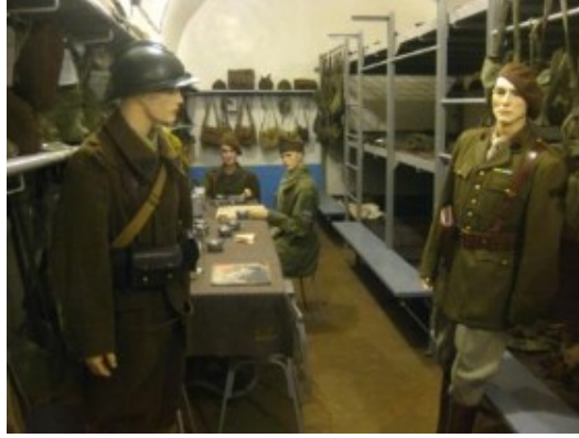
La vida no era fácil allí