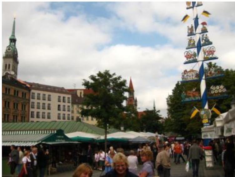
Munich. El "Viktualienmarkt"