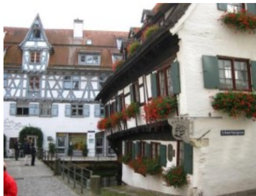
Ulm. Fischer und Gerberviertel

También sobresale por su encanto el “Fischer und Gerberviertel” (El barrio de los artesanos) con sus callejuelas y casas de entramado junto al Danubio. El resto de la ciudad apenas tiene interés porque tras los estragos de la guerra, se reconstruyó en estilo moderno. No obstante su zona medieval justifica sobradamente la visita a la ciudad. Al menos para mi, que tras dos intentos fallidos de visita a Ulm, a la tercera fue la vencida. Y valió la pena.