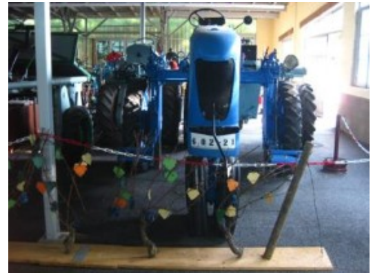
Los tractores vinícolas