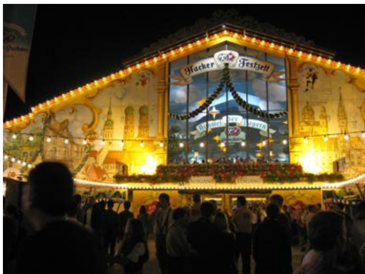
La Hacker Festzelt

Seguramente quien visite Alemania y la Oktoberfest por vez primera recibirá una impresión mucho más impactante y favorable, pues tanto el ambiente y las carpas de las cerveceras, como los puestos en general son muy espectaculares.