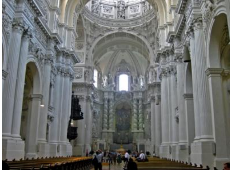
St. Cajetan - San Cayetano

Un poco saturados de tanto desfile, hicimos una ruta a pie por el Munich monumental: Königsplatz, Odeonplatz, la iglesia real de St. Cajetan y la Residenz, el palacio real, para terminar nuevamente en el Viktualienmarkt, que por ser domingo, estaba cerrado.