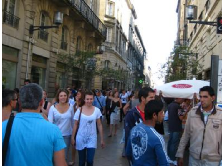
Burdeos. La Rue Ste.Cathérine

Nos vimos tres o cuatro tiendas de accesorios, compramos algunas cosillas, comimos tranquilamente en el camping, pasamos la tarde haciendo unas compras por la peatonal Rue de Sainte Cathérine -la principal calle comercial de Burdeos- y cenamos con los amigos. Un día “redondo”.