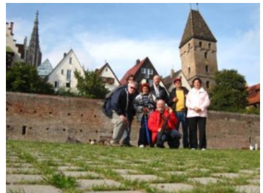
Ulm. La muralla junto al Danubio

Regresamos a Tübingen, a casi 100 km. de distancia, por la autopista A-8, aunque a la ida hubiéramos optado por hacer la ruta por la serpenteante carretera que discurre entre colinas.