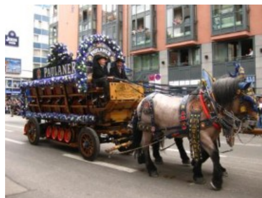
Carrozas a todo trapo...