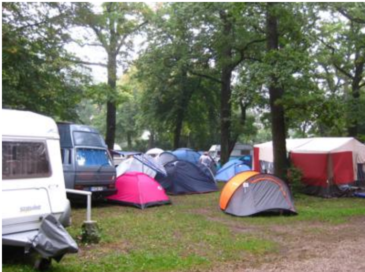
Amontonamiento en el camping Obermenzing

Es más, un par de noches después, el dueño del camping pasó por allí y nos preguntó qué tal estábamos y que si la “discoteca” que un campamento de decenas de tiendas inglesas tenía montada, nos molestaba. Yo le dije que había un cartel que decía que a las 22 h. era hora de silencio y me contestó que sí, pero el resto del año, que durante la Oktoberfest, pues ya se sabía, pero que, en cualquier caso, a medianoche debían callarse. No lo hicieron ningún día, pues lo normal fue que el ruido durase hasta la una, más o menos.