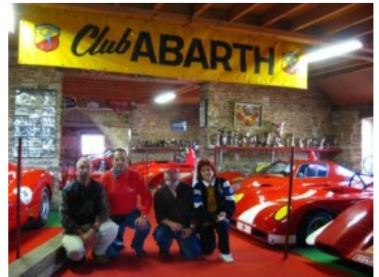
Con los Abarth