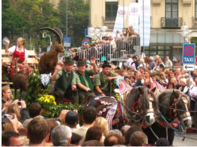
La cabra es de verdad...

Mucho más larga que la del sábado -dura dos horas y media- discurre por gran parte del centro de la ciudad y también termina en Theresienwiese, en el recinto ferial. La verdad es que después de haber visto la cabalgata del día anterior -aquí vuelven a salir los mismos carros y las mismas bandas de música- eso sí, todo multiplicado por equis, porque sale hasta el apuntado, ésta se hace un poco pesada. La primera hora se pasa muy a gusto, pero no resistimos más de hora y media de desfile, pues, como ya hemos dicho, cansa un poco ver tanto traje típico uno tras otro. Ya se sabe que lo bueno, si breve, dos veces bueno.