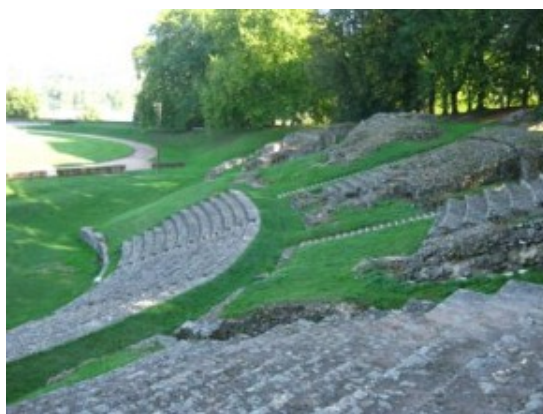
Autun. El anfiteatro romano