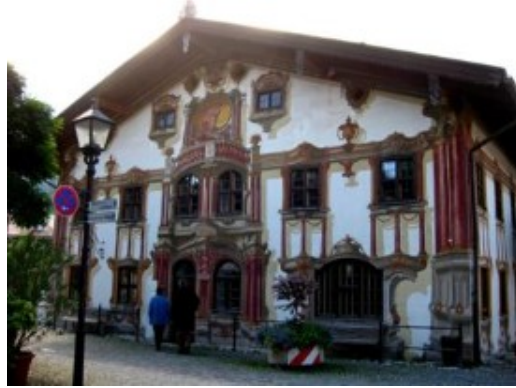
La Pilatus Haus