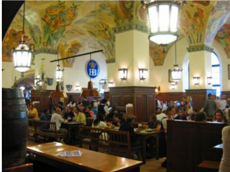
Aquí Hitler se montó su golpe de estado de opereta...