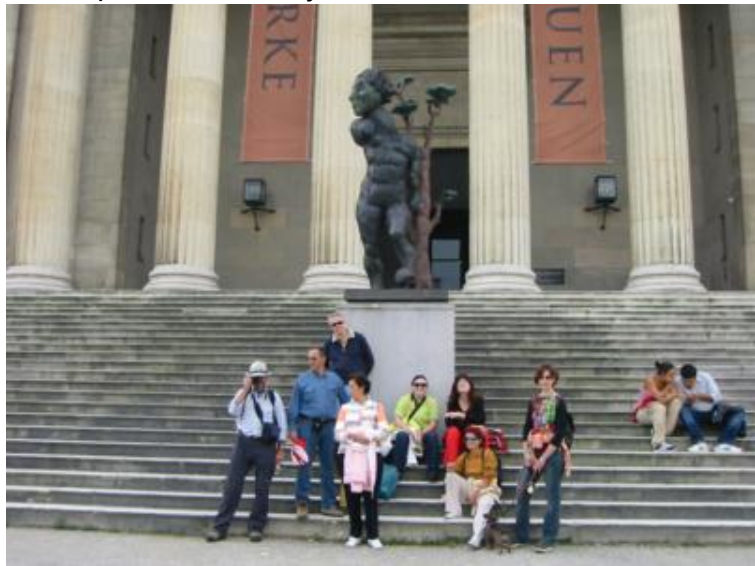
Todos en Munich

De Valladolid saldríamos dos caravanas y cinco personas, pero ahí no terminaba la cosa. En Tübingen (Alemania) se nos unirían también Pepe y Nany, nuestros amigos castellonenses. Y en Munich se sumarían al grupo dos amigas más que llegarían a en avión para vivir todos juntos la Oktoberfest.