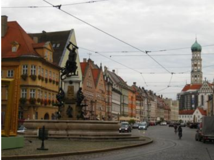
Augsburg. La Maximilianstrasse

El otro gran punto de interés de Augsburg es el “ Fuggerei ”, el barrio de casitas para gente pobre, fundada por la familia Fugger en el siglo XV y que pasa por haber sido la primera ONG de la historia. En la actualidad es un conjunto de casas y callecitas muy tranquilas, a las cuales se accede a través de una arcada porticada. A las ocho cierran la puerta, así que hay que visitar el Fuggerei antes de esa hora.