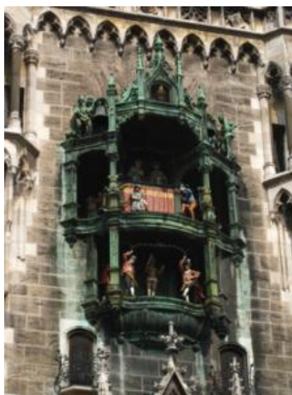
El reloj del Ayuntamiento nuevo

Como quien más quien menos quería llevar algunos regalitos y recuerdos de la "Oktoberfest" a casa, después de dos días "de prospección" de precios -que varían y mucho de unos sitios a otros- llegamos a la conclusión de que uno de los sitios más baratos de todo Munich es el kiosco que hay en la avenida peatonal Neuhauserstrasse, junto a Karlplatz. Pero como no era cuestión de ir cargados todo el día con jarras de cerveza y otros souvenirs, pues dejamos las compras para más tarde.