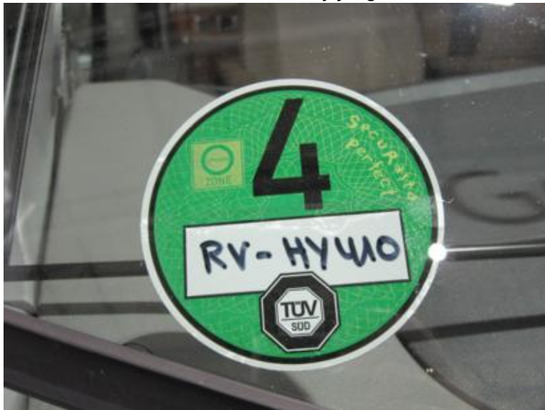
La nuestra es más bonita, pero contra gustos...