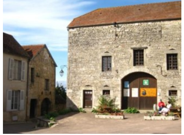
"Decorado de cine" en Flavigny

Como a pocos kilómetros de Flavigny se encuentra Alésia , la colina donde tuvo lugar la derrota del ejército galo frente a las legiones romanas de Julio César, nos acercamos a verla. Allí estaba la estatua de Vercingétorix, el jefe galo, famoso especialmente por las aventuras de Astérix y Obélix. En el lugar hay unas ruinas de lo que tuvo que ser la aldea, así como un templete y la estatua, en el sitio donde se supone que tuvo lugar aquella batalla.