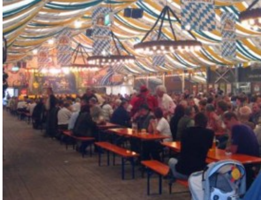
Moosburg. "La Mini-Oktoberfest"