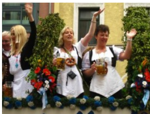
La de jarras que servirán...