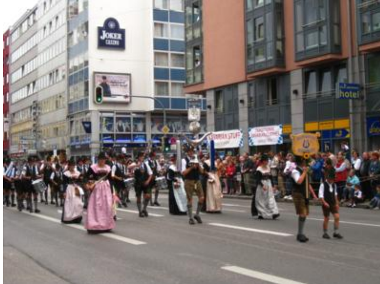
Desfilando por la Sonnenstrasse...

Como esta cabalgata es un evento que atrae a muchísima gente, recomendamos estar a pie de calle al menos media hora antes de que pase por ese lugar, pues sería una pena no poder verla bien. Nosotros la vimos desde la misma avenida Sonnenstrasse, que por ser muy larga y ancha, se les ve venir perfectamente. El reportaje fotográfico lo agradecerá sin duda.