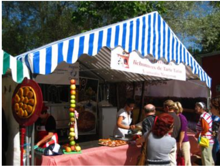
A por las "Tartes Tatin"...