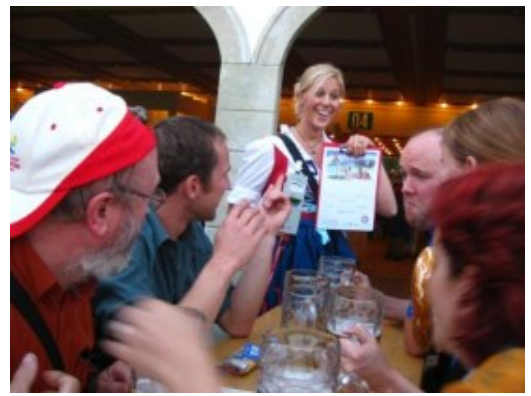
Y luego el certificado acreditativo...

Y así, tras el ritual final de la manzana de caramelo de Pili -verde esta vez-, nos despedimos definitivamente de la Oktoberfest, pues al día siguiente tocaba empezar el regreso a casa.