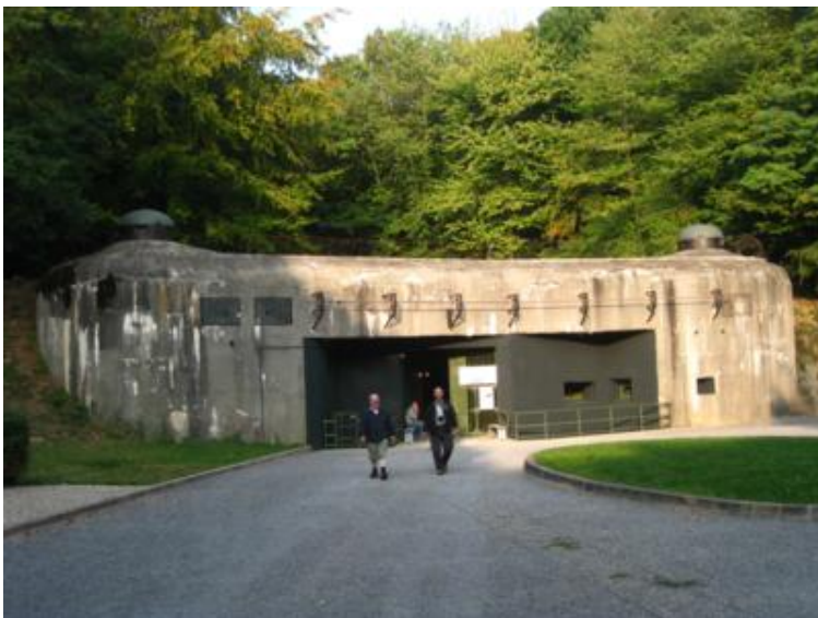
La entrada al Fort de Schoenenbourg