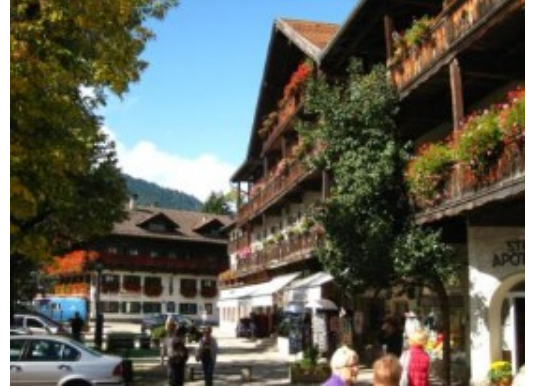
Flores en Oberammergau

De camino a Mittenwald, otro de los hitos de la jornada, nos detuvimos en Garmisch-Partenkirchen , localidad famosa por ser la sede de los saltos de esquí el día de Año Nuevo.