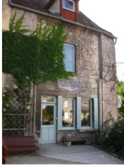
La tienda de los anises