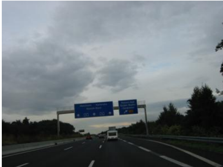
En Alemania. Esa caravana es la nuestra...

Teniendo en cuenta que viajamos con una caravana detrás, no todas las gasolineras de supermercados son fácilmente accesibles con el remolque detrás, así que utilizo el Google Maps para “visualizar” vía satélite si el lugar parece o no apto para repostar en él. Y el truco funciona. También me valgo de la utilísima web francesa www.zagaz.com en la que se informa de las gasolineras francesas y sus precios. Si no lo has hecho antes, lee más sobre cómo repostar barato en Francia, pinchando aquí.