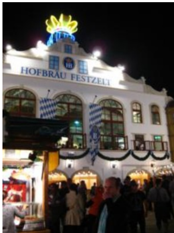
Al menos aquí pillamos sitio... fuera.

Tras dar una vuelta por el ferial, encontramos una mesa libre en el exterior de la carpa de la “Hofbräuhaus”. A alguien se le ocurrió que preguntase a la “fräulein” de turno si servían jarras de medio litro... ¡Y la carcajada que soltaron al oírlo los de la mesa vecina fue de las que hacen historia! Un litro o nada, ya lo sabéis, al menos allí. Compramos unos codillos en “La casa del Codillo”, unos puestos más allá, -a precio “Oktoberfest, por supuesto”- y nos los comimos sentados en la mesa de la carpa, a pesar de que sirven comidas.