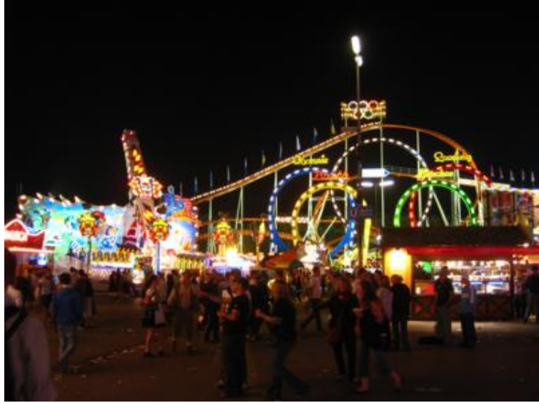
Unas "ferias" a lo bestia...

La verdad es que mucha gente viste el traje bávaro típico, lo que se agradece de veras, pues le da mucho sabor al ambiente. Y no sólo en la Oktoberfest, pues durante el evento, por las calles de la ciudad la gente viste igual... ¡que para algo están en fiestas!