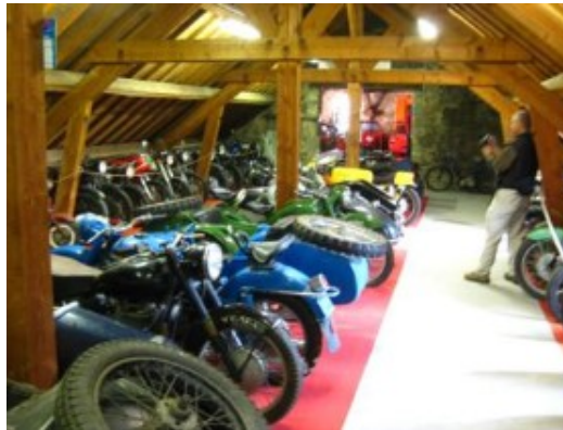
El museo de las motos