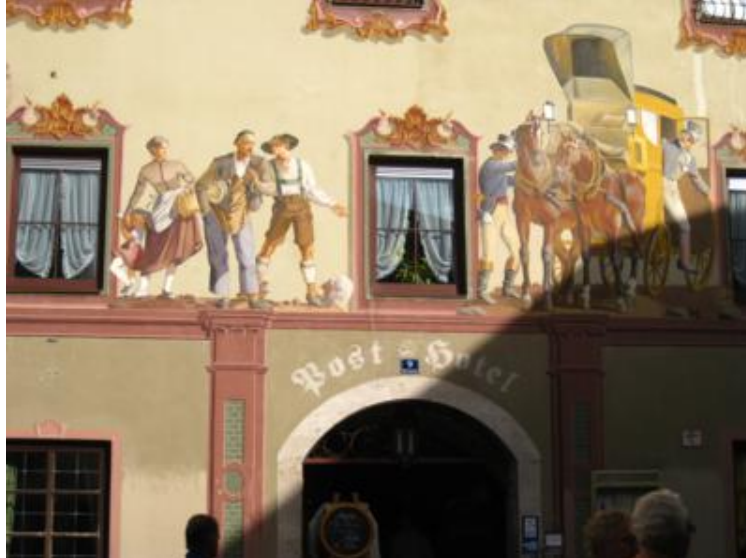
Fachadas pintadas en Mittenwald