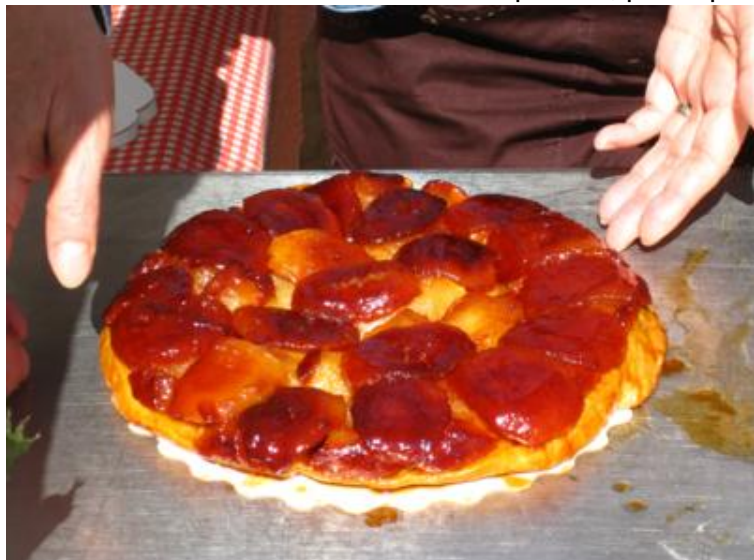
A la rica "Tarte Tatin"

Así que, después de avituallarnos con productos típicos, pusimos rumbo a la " Foire de la Tarte Tatin ", que se celebra el segundo fin de semana de septiembre en el pueblecito de Lamotte-Beuvron -al sur de Orléans- localidad natal de las hermanas Tatin, "inventoras" de la afamada "Tarte Tatin" que lleva su nombre y que no es otra cosa que una tarta de manzana hecha del revés. Riquísima, por supuesto.