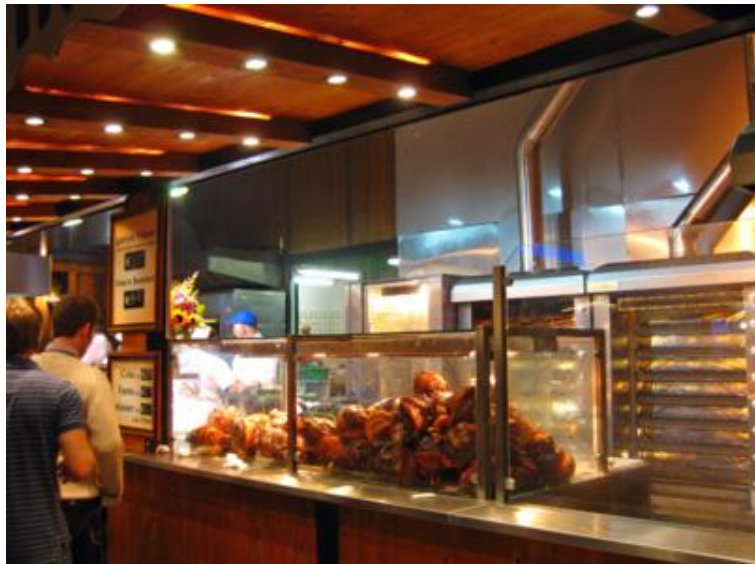
Esto son codillos asados. Los más caros de todo Munich...