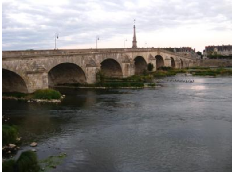
Blois - Puente medieval sobre el Loira

Aunque era domingo y sabíamos que la ciudad estaría casi “muerta”, su castillo y sus calles medievales eran un atractivo más que suficiente para terminar la jornada dando un paseo por Blois. Y así lo hicimos. Y es que muchas veces los domingos plantean serios problemas. Pincha aquí para saber un poco más de “cómo manejar” los domingos y días festivos para que no nos hagan mucho la pascua al planificar el itinerario.