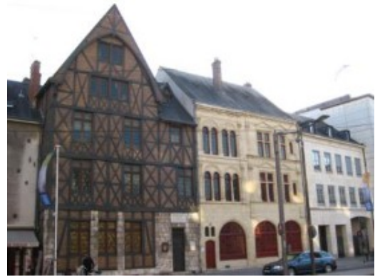
"La casa" de Juana de Arco