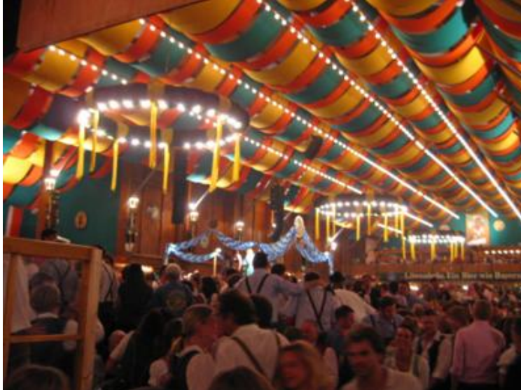
Las carpas están siempre a tope