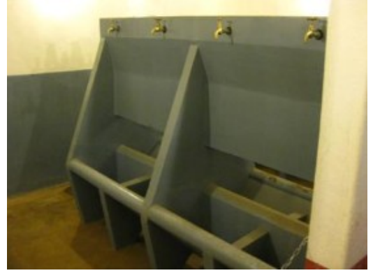
Nos quedamos con el Thetford...

A través de larguísimos túneles, se recorren varias torretas de tiro, almacenes de munición, la zona de cuartel: dormitorios, cocinas, etc. así como otras dependencias. La visita es muy interesante para quien aprecie la historia de la Segunda Guerra Mundial. El fuerte nunca fue tomado al asalto y sólo se rindió tras el armisticio francés, en junio de 1940. Más información en www.lignemaginot.com/index10.htm