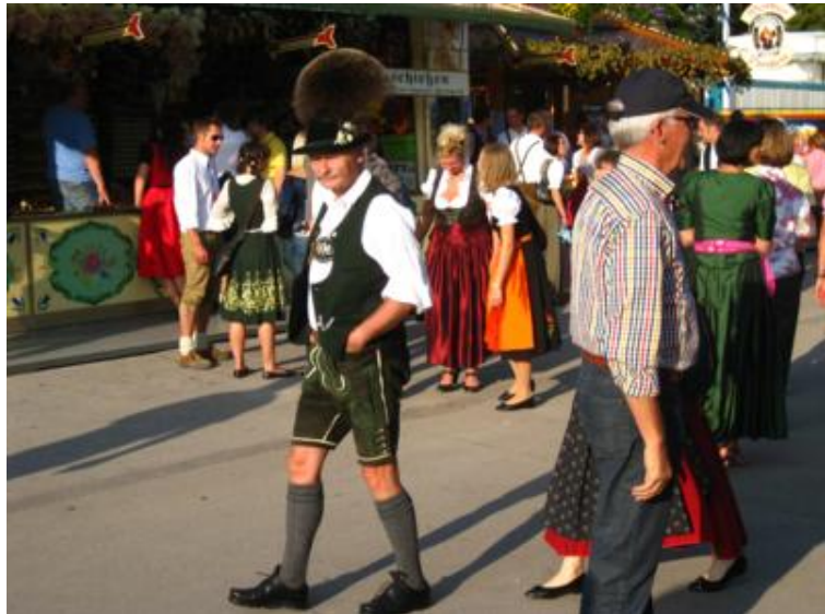
Bávaros hay muchos, pero éste se salía...

La verdad es que mucha gente viste el traje bávaro típico, lo que se agradece de veras, pues le da mucho sabor al ambiente. Y no sólo en la Oktoberfest, pues durante el evento, por las calles de la ciudad la gente viste igual... ¡que para algo están en fiestas!