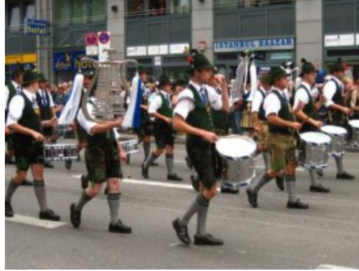
Baviera en estado puro.