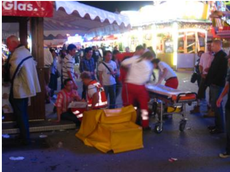
Dando trabajo a los equipos de socorro...

Claro que cuando la moderación se deja en casa es cuando aparecen las famosas curdas que han hecho también famosa a la fiesta de la cerveza muniquesa. La verdad es que vimos unas cuantas, no diremos que no -los servicios de socorro no se aburren demasiado- pero tampoco tantas como yo me esperaba.