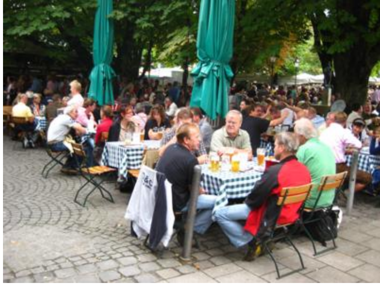
Imposible pillar mesa en el "Biergarten"...

Aunque la Oktoberfest ya estaba inaugurada, al ser sábado y coincidir con el primer día de fiesta, optamos por dedicar la tarde a recorrer Munich y dejar la Oktoberfest para el día siguiente, pues si la fiesta es importante, la ciudad también.