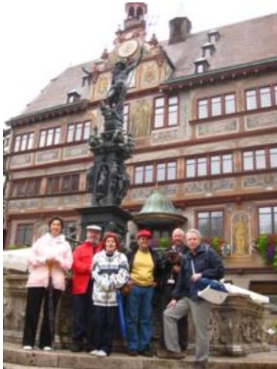
El ayuntamiento de Tübingen