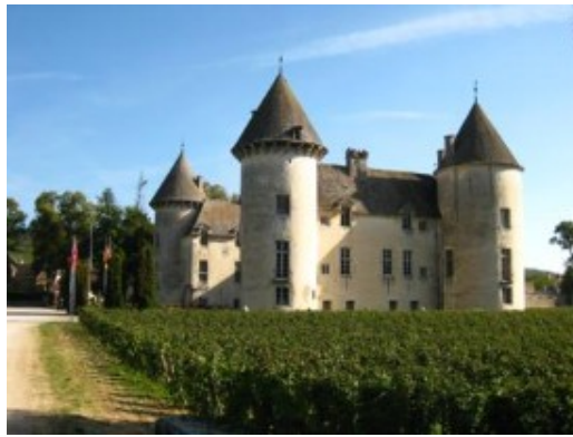
El castillo de Savigny les Beaune

aviones de combate, coches Abarth de competición, motocicletas, tractores y maquetas, pues el propietario del castillo es un auténtico entusiasta tanto de la competición como de los cazas de combate. La visita nos llevó tres horas. La web del castillo es http://reception-aviation.chateau-savigny.com/ Abre de 9 a 18,30 h.