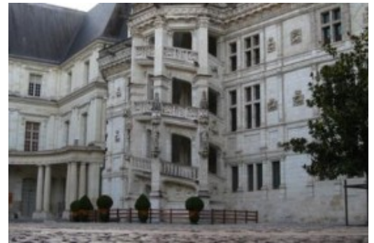
La famosa escalera del castillo