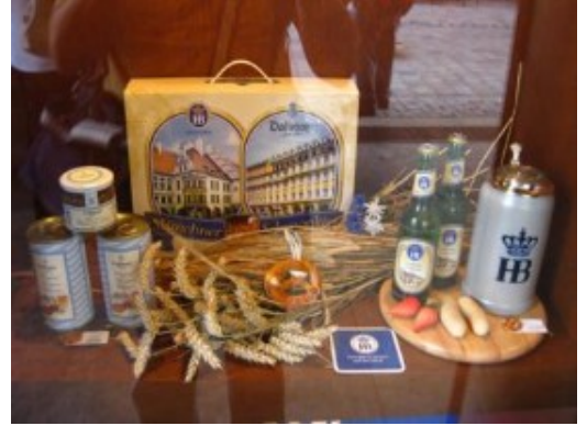
Productos de la "Hofbräuhaus"