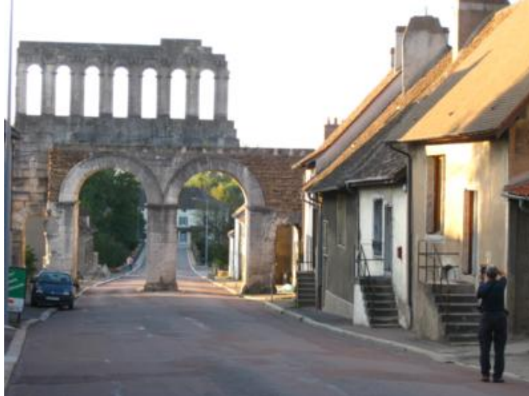
Autun. "La porte d'Arroux" romana

Autun es una de esas ciudades francesas de provincias, tranquilas, pero con menos "salsa" de la esperada. La visita nos la habían recomendado entusiastamente unos holandeses que conocimos en el camping de Beaune unos años antes, así que para allá que fuimos, a ver qué tal.