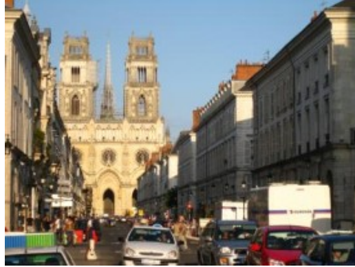
Orléans - La Catedral