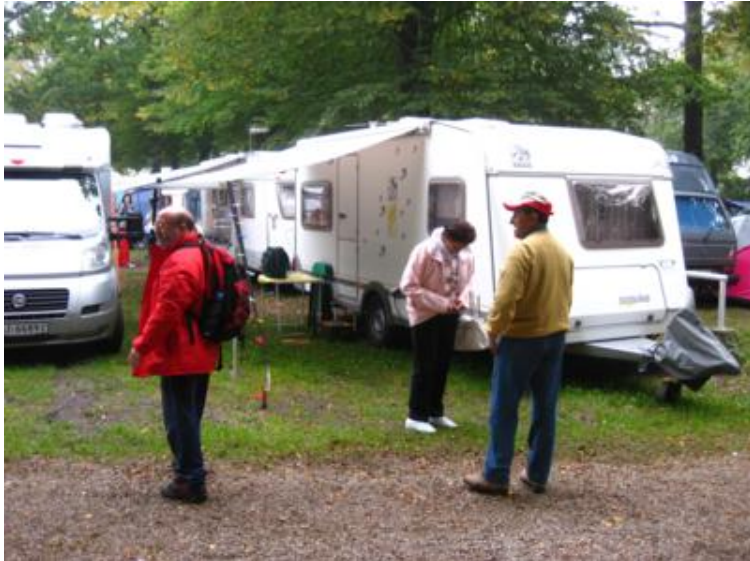
Y gracias al toldo, que si no ni nos dejan abrir la puerta...