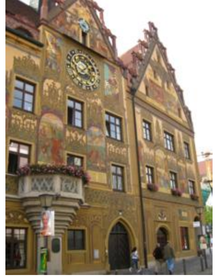
El Rathaus (Ayuntamiento)