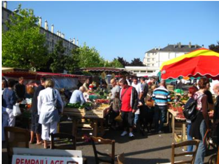
Marché de la Madeleine - Orléans