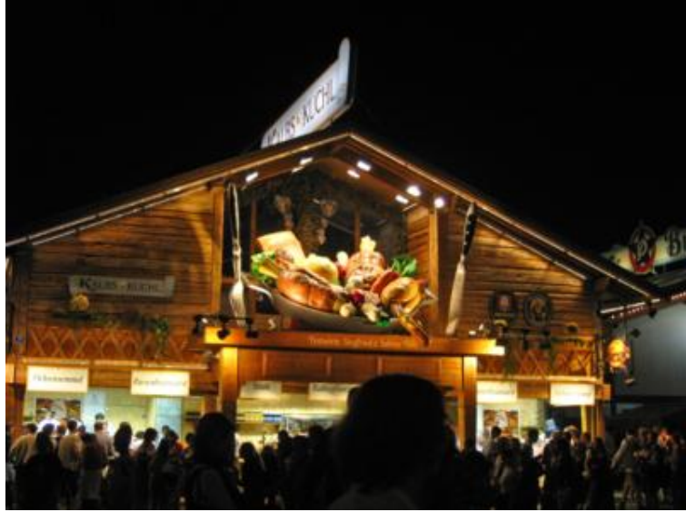
Las casetas son verdaderamente bonitas