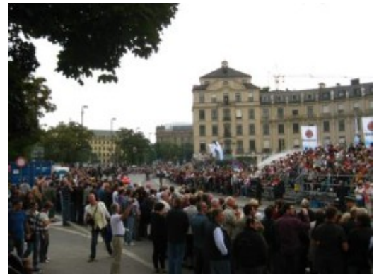
y poca visibilidad. Luego se puso a tope.

Vimos el desfile desde Karlplatz, que salvo que lleguéis muy temprano y pilléis un buen sitio, no es muy buena ubicación que digamos. Si lo hubiéramos sabido, nos hubiéramos colocado en Sonnenstrasse, la avenida del día anterior, que es mucho mejor elección.