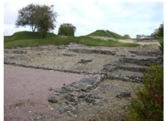
Las Ruinas de Alésia

Terminamos el día en la bonita ciudad medieval de Sémur en Auxois , con su muralla, sus torres medievales y sus casas de entramado. De regreso al camping, nos fuimos al pueblo vecino en busca del amigo de la furgoneta de pizzas...que resultó ser un aficionado a la cría de caballos de carreras, algunos de los cuales habían ganado varios premios. ¡Hay que ver lo que dan de sí las pizzas!.