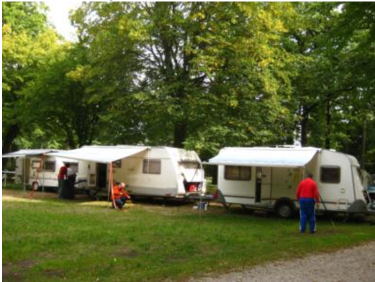
Después del "Eins, zwei, drei..." ¡Toldos abiertos!

No obstante, por si acaso, les pregunté qué distancia iba a dejar entre caravana y caravana, una vez hubieran embutido el montón de elementos de acampada en aquel trozo de tierra que, por lo visto era más preciada que el oro. Dos metros, centímetro arriba, centímetro abajo, fue la respuesta del de la vespa, que estaba visto que era el "Sheriff" del lugar.