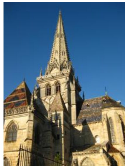
La catedral de St.Lazare