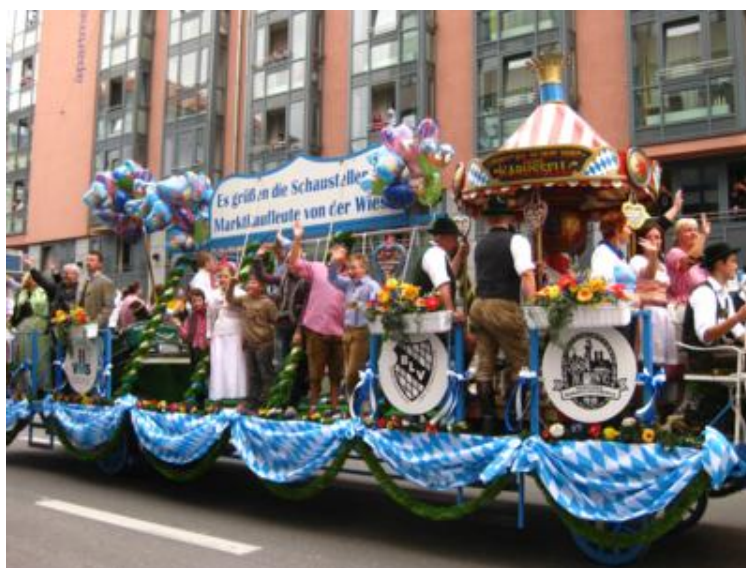
La Cabalgata inaugural de la Oktoberfest

Aunque oficialmente la “Oktoberfest” da comienzo cuando a las doce en punto del sábado, el alcalde de Munich abre el primer barril de cerveza en la carpa de la cervecería “Schottenhamel”, pronunciando las palabras rituales: “O 'zapft is!”; la “Cabalgata de carretas cerveceras” , que precede al evento del barril, es mucho más interesante y accesible para el visitante. La web oficial de la Oktoberfest es www.oktoberfest.de/en/