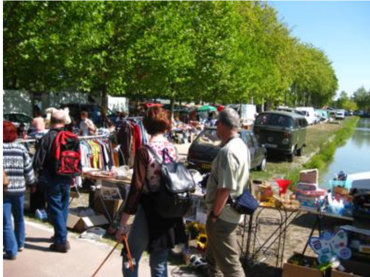
La "foire" no resultó tan bonita como esperábamos...

La verdad es que esperábamos mucho más de la feria, así que nos quedamos bastante decepcionados con lo que allí nos encontramos. El aspecto general del evento era bastante cutre, a pesar de celebrarse en un parque municipal bastante bonito, al lado de un canal.