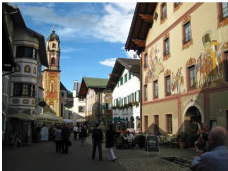
La calle principal de Mittenwald

Unos kilómetros más allá, casi en la frontera austríaca, se encuentra Mittenwald , otra preciosidad de pueblo. Su calle principal, llena de terrazas y fachadas pintadas es como un museo al aire libre. El pueblo está especializado en la construcción de violines y en una placita que hay detrás de la iglesia encontraréis un enorme violín en mitad de una rotonda.