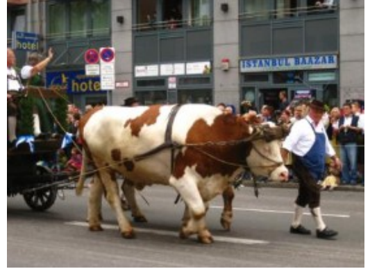
El cuidador iba a juego...