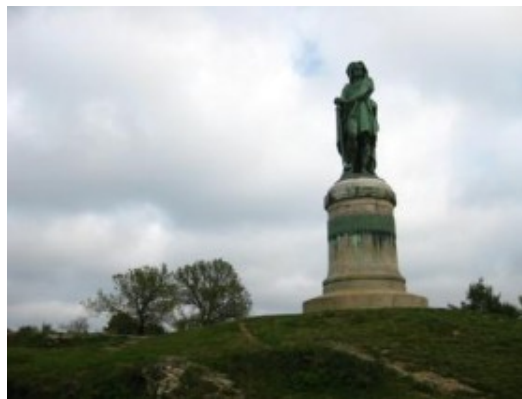
Alésia. Estatua de Vercingétorix

Como a pocos kilómetros de Flavigny se encuentra Alésia , la colina donde tuvo lugar la derrota del ejército galo frente a las legiones romanas de Julio César, nos acercamos a verla. Allí estaba la estatua de Vercingétorix, el jefe galo, famoso especialmente por las aventuras de Astérix y Obélix. En el lugar hay unas ruinas de lo que tuvo que ser la aldea, así como un templete y la estatua, en el sitio donde se supone que tuvo lugar aquella batalla.