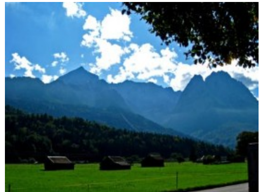
El Zugspitz, el pico más alto de Alemania

El pueblo en sí no vale gran cosa, pero sí que vale la pena hacer una parada en el estadio olímpico edificado por Hitler para los juegos de invierno del '36. La entrada es libre y se puede observar tanto el antiguo trampolín de saltos, como el nuevo y gigantesco trampolín inaugurado hace pocos años.