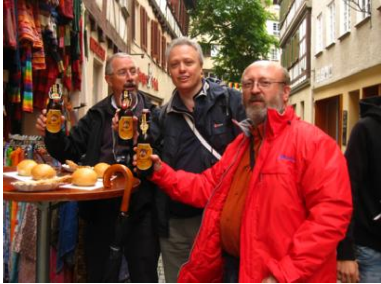
La primera cerveza alemana del viaje