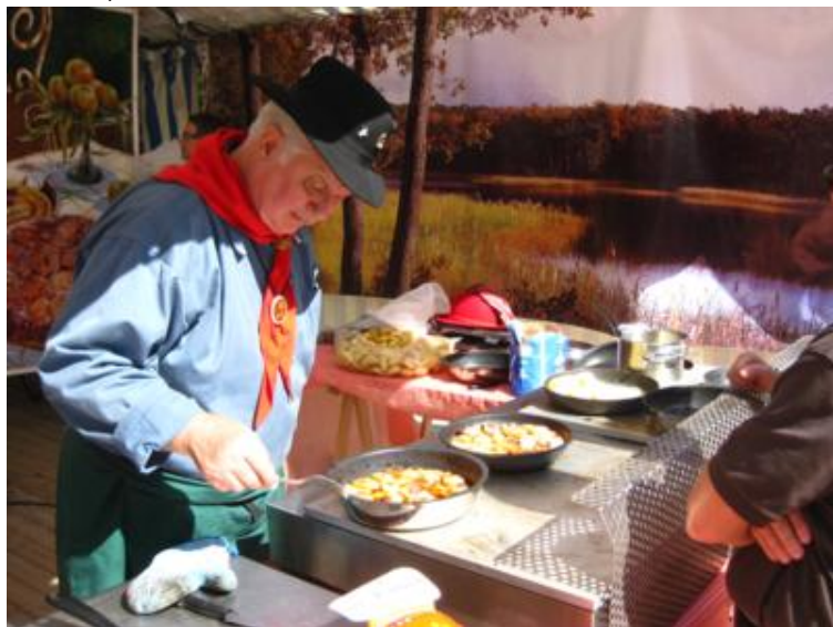
Preparando la "Tarte Tatin"

La feria en cuestión se componía de varios tenderetes que ofrecían productos de la gastronomía de la zona, foies y vinos, amén, por supuesto, de las tartas Tatin, a la cual le hicimos los debidos honores, faltaría más. Había expuestos varios coches antiguos, una exposición de maquetas, un típico "vide grenier" que tanto gusta a los franceses y poco más. Un "vide grenier" es un mercadillo de viejo en el que los lugareños -y no lugareños- ponen a la venta los trastos que no quieren, libros usados y otra parafernalia. Lo mejor de todo fue ver cómo se elabora, en vivo y en directo, la Tarte Tatin, auténtica razón de ser de la fiesta.