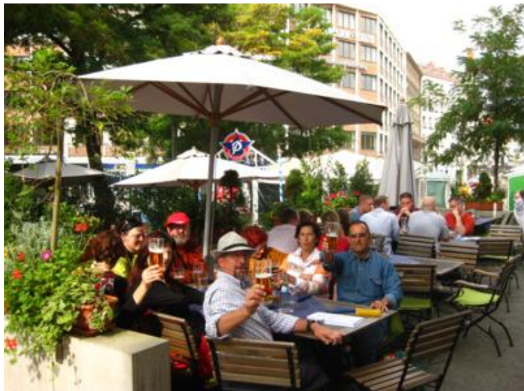
Fantástica comida en "Hacker-Pschorr"

En una esquina se encuentra la cervecería “Hacker-Pschorr”, tan bonita por dentro como por fuera. Comer o cenar en una “bräuerei” alemana es una experiencia que nadie debiera perderse en un viaje a Alemania. Se come de maravilla, generalmente un plato único de carne o pescado con guarnición. La jarra de medio litro de cerveza suele rondar los 3-4 €, dependiendo del lugar. A modo orientativo digamos que salimos a unos 20 € por cabeza, repitiendo cerveza, lo que está más que bien. ¡A fin de cuentas aquello también era un poco “Oktoberfest”!.