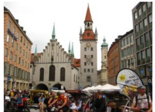
... y el viejo.