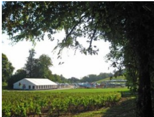
Los aviones de caza