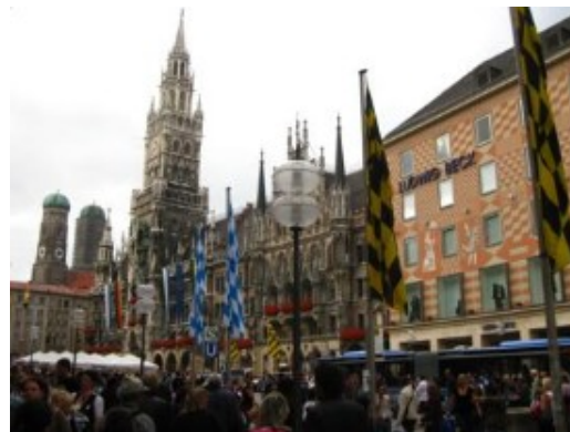
Munich. El ayuntamiento "nuevo"...