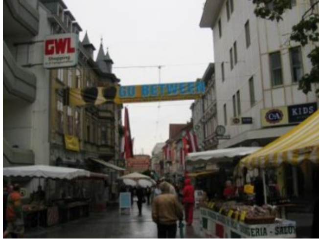
Más lluvia en Bregenz