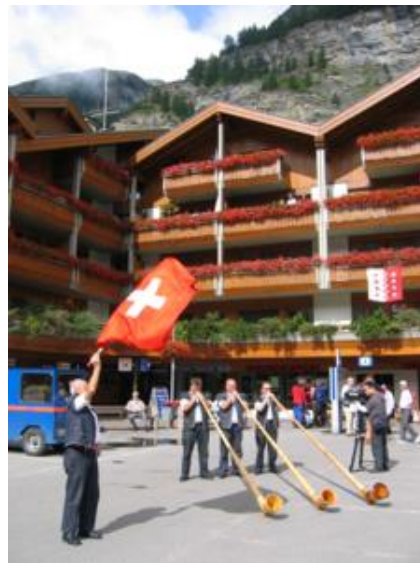
Ambiente suizo en Zermatt

El pueblo es una monada y salvando el hecho de que medio mundo haya tenido la misma idea que tú, mola cantidad. Decididos a disfrutar la “Suiza más típica”, nos regalamos una succulenta fondue de queso para comer y también probamos el “rösti”, sempiterno plato, único o como acompañamiento, a base de patatas paja fritas y aplastadas, con o sin queso.