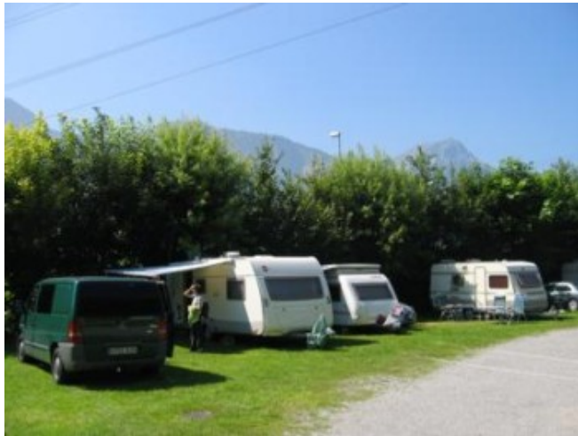
El camping Moosbad, en Altdorf

Acampamos en el camping “Moosbad” de Altdorf . Ojo con los horarios, pues en Suiza, como en Alemania y Austria, tienen la costumbre de “cerrar” los camping de 13 a 15 h. por descanso, el Mittagruhe, y consecuentemente, no podréis entrar o salir durante ese tiempo.