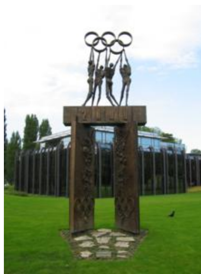
El Museo Olímpico

En Ouchy, la zona selecta y residencial de Lausanne y sede del Museo Olímpico, el domingo ponen un pequeño mercadillo. Así que bajo un espectacular cielo azul, color que casi habíamos olvidado en los últimos días, y después de ver, por fuera, la sede del COI, nos dimos una vuelta por el mercadillo gastronómico, junto al lago.