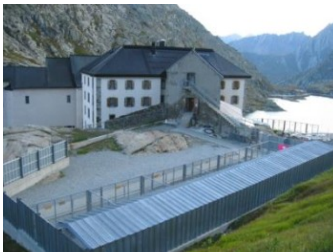
Las poco románticas perreras de San Bernardo

Actualmente para llegar a Italia hay un túnel-frontera, de peaje, que evita tener que subir el puerto a cambio de perderse las espectaculares vistas. Siendo como es la cuna del perro de San Bernardo, aún existe un pequeño museo-criadero de esos “diminutos” canes. Aunque a esa hora estaba lógicamente cerrado, desde lo alto de un montículo se ven las perreras. Pocos animales había. Varios adultos y tres o cuatro cachorros bastante crecidos. Como al menos las tiendas de souvenirs estaban abiertas, el cielo estaba despejado y pudimos ver a los perritos, aunque llegamos a las 00,20 h. al camping, disfrutamos mucho con la excursión.