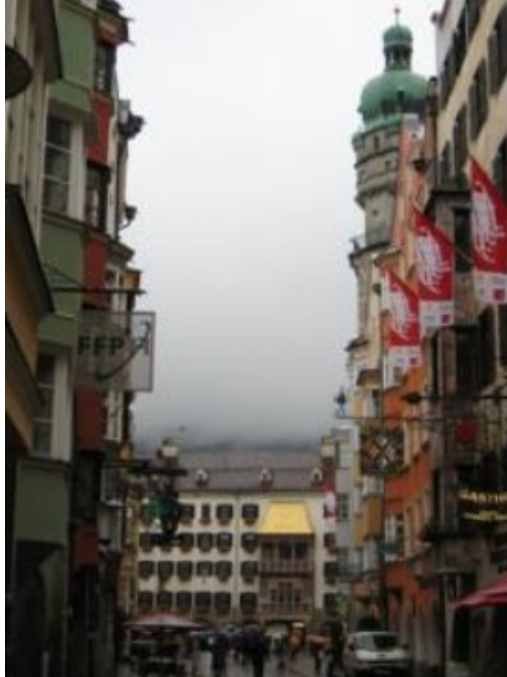
Nubes a ras del tejadillo de oro Innsbruck

Muy interesantes son los característicos soportales llenos de tiendas y también muy útiles en caso de lluvia para pasear sin sobresaltos, pero aquel momento no nos hizo falta porque, por fin, nos había dado una tregua.