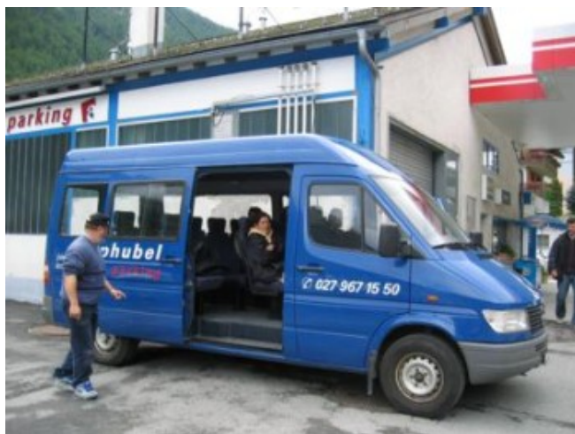
El "taxi" a Zermatt

El tren es muy caro, salvo que dispongáis de alguno de los muchos pases de ferrocarril que abaratan mucho los costes. En Täsch la calle del pueblo está abarrotada de ofertas de “parking + taxi”. El aparcamiento del coche para todo el día costó 5 CHF y otro tanto por persona para el servicio de furgoneta-taxi hasta Zermatt. Para regresar es necesario llamar por teléfono al taxista para que suba a recogerlos. No suele haber problemas de idioma, suben rápido y nos cobrarán otros 5 CHF por pasajero por el regreso.