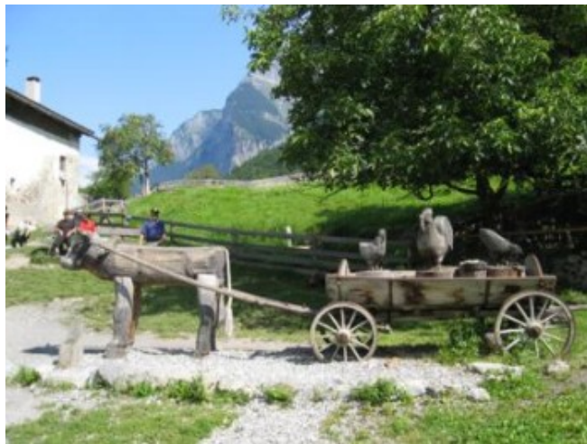
Exterior de la "Casa de Heidi" - Maienfeld

“ Heididorf ”, el pueblo de Heidi, está unos kilómetros más arriba, en la falda de la montaña. Allí encontraréis “su casa”, ambientada en el siglo XIX y con los personajes de la novela: el Abuelo, Pedro, etc. aunque no con el aspecto de la famosa serie japonesa. Claro que eso no preocupa a las hordas de japoneses que abarrotan el lugar. La entrada cuesta 5 CHF. Hay un aparcamiento para autocares y coches en el restaurante próximo a la casa, por lo que pudimos aparcar las caravanas.