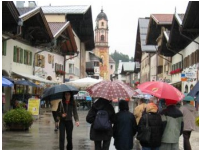
Paraguas en Mittenwald

Antes de entrar en Austria, todavía nos faltaba dar un paseo por Mittenwald . Hay quien afirma que se trata del pueblo más bonito de los Alpes bávaros, pero yo me quedo con Oberammergau. Desde luego es precioso también, aunque no sé si porque el día no acompañaba me pareció más de lo mismo, pero en una sola calle. En cualquier caso, recomendamos totalmente su visita.