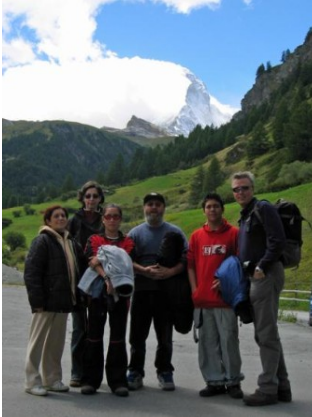
Todos frente al Cervino o lo que se veía

El pueblo es una monada y salvando el hecho de que medio mundo haya tenido la misma idea que tú, mola cantidad. Decididos a disfrutar la “Suiza más típica”, nos regalamos una succulenta fondue de queso para comer y también probamos el “rösti”, sempiterno plato, único o como acompañamiento, a base de patatas paja fritas y aplastadas, con o sin queso.