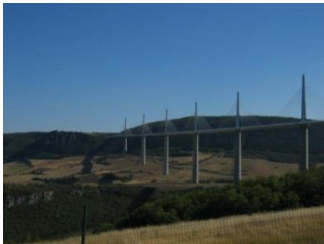
El viaducto de Millau

Hasta las proximidades de Mende, circulamos muy bien por la nueva A-75, autopista afortunadamente gratuita que va de Montpellier a Clermont-Ferrand. La sorpresa agradable del día fue tropezarnos con el ya famoso viaducto de Millau , el más alto del mundo con sus 300 metros de caída. Cuesta 6 € de peaje. Se ha habilitado junto al viaducto un “área-mirador”, con un enorme parking, para contemplar tan impresionante obra de ingeniería. Hay también varias carpas con exposiciones sobre la construcción del viaducto y los recusos turísticos de la zona, con especial hincapié en el queso roquefort que se produce muy cerca de allí.