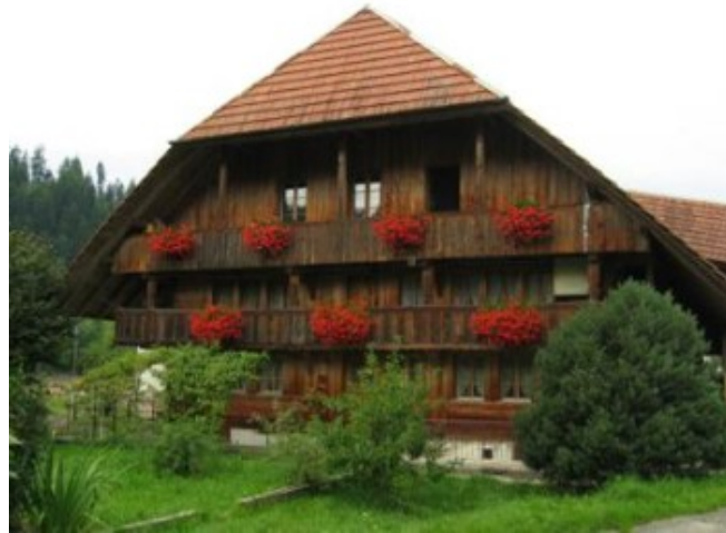
Granja típica del Valle de Emmental

A las 12, 15 h. salimos rumbo al valle de Emmen o Emmental , famoso también por su queso de agujeros. ¡Era el día del queso, estaba visto! El valle está al lado mismo de Berna y su mayor atractivo son las espectaculares granjas de madera, con techo a dos aguas que casi toca el suelo y las fachadas llenas de flores. Praderas verdes, suavemente onduladas, llenas de vaquitas. Suiza en estado puro, vamos. Más que los pueblos, es la zona la que resulta interesante.