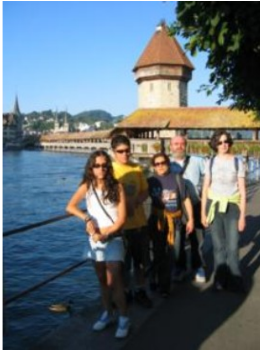
Luzern, junto al Puente de la Capilla

El símbolo de la ciudad es el medieval y fotogénico “Puente de la Capilla”, afortunadamente restaurado después del incendio de 1993. Construido en madera, todavía están reconstruyendo en facsímil las pinturas policromadas que adornan toda su longitud. La ciudad tiene otro puente de similares características, menos conocido, pero intacto, unos cientos de metros río arriba. Allí las pinturas son auténticas y desde allí divisaréis algunos lienzos de muralla en plena colina.