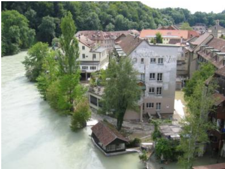
Inundaciones en Berna

Volvimos al camping a comer y después nos fuimos todos, en amor y compañía, a Berna . Afortunadamente los inundados barrios bajos estaban ya casi despejados. De todas maneras el casco histórico queda en lo alto de la colina y lógicamente se libró del desbordamiento del río. Menos mal que, por azares del destino, pudimos ir “esquivando” las zonas de inundación que asolaron el país aquel verano de 2005.