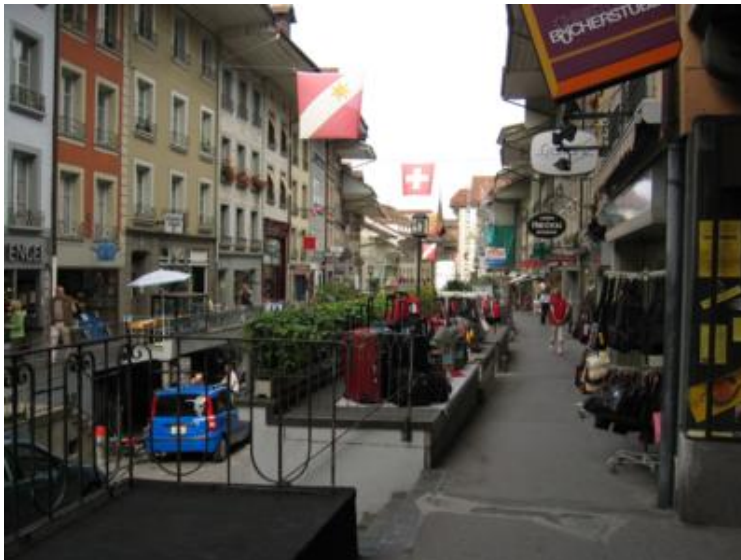
Thun y sus pintorescas calles

La primera parada del día la hicimos en Thun , ciudad con un castillo y un interesante casco medieval a sus pies. El sábado era día de mercado. A pesar de que las aguas ya habían vuelto a su cauce, en las calles todavía trabajaban las bombas extractoras y los sacos terreros aún se veían por todas partes. Thun presume de tener una peculiar calle Mayor. Su rareza es tener los comercios debajo del nivel de las aceras. Con una acusada pendiente, para acceder a ellos hay que ir bajando escaleras. En fin, otra curiosidad más que es lo que hace los viajes interesantes.