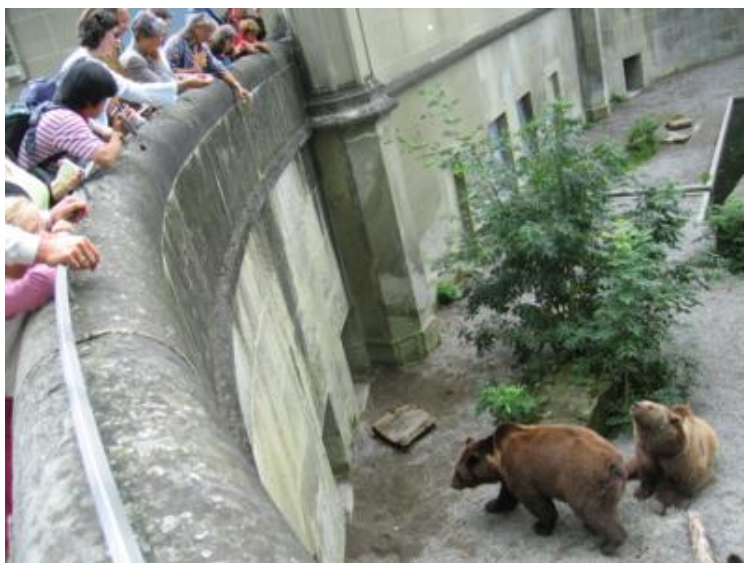
Berna - El foso de los osos

A las horas en punto, en la famosa torre del reloj de la ciudad, la Zeitglockenturm, y como buenos “guiris” vimos moverse las figuritas que tanta expectación despiertan. Otra atracción muy divertida es el foso de los osos, animal-símbolo de Berna, que hay en pleno centro urbano. La gente se arremolina alrededor del foso, mientras los descarados osos pardos “se esfuerzan” en pedir los trozos de fruta que se compran allí mismo a los visitantes y que es la única comida autorizada que se les puede dar. Es muy, muy divertido.