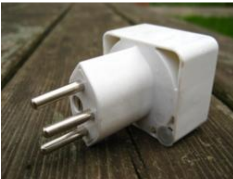
El adaptador suizo

Ojo, los enchufes suizos son especiales, de forma hexagonal y con tres bornes. En recepción alquilan adaptadores, y menos mal porque el asunto nos pilló a contrapelo porque no teníamos ni idea de ello, pero en cuanto pudimos nos compramos uno al nada módico precio de 6,90 francos suizos, ya que no existe garantía de que en todos los camping los alquilen y no abundan los que disponen de enchufes europeos.