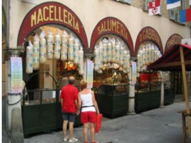
Salamis en Lugano

Sin embargo, en el Ticino no se sigue esa práctica y a las 18-18,30 h. las tiendas bajaron la persiana. Lugano es una ciudad señorial, italiana por los cuatro costados, pero con la sempiterna pulcritud suiza. En suma, una “curiosidad” latina en un mundo germánico. El apodo de “Río de Janeiro suizo” nos parece un poco excesivo, aunque creo que se debe a la montaña que hay junto al lago se parece al “Pan de Azúcar”.