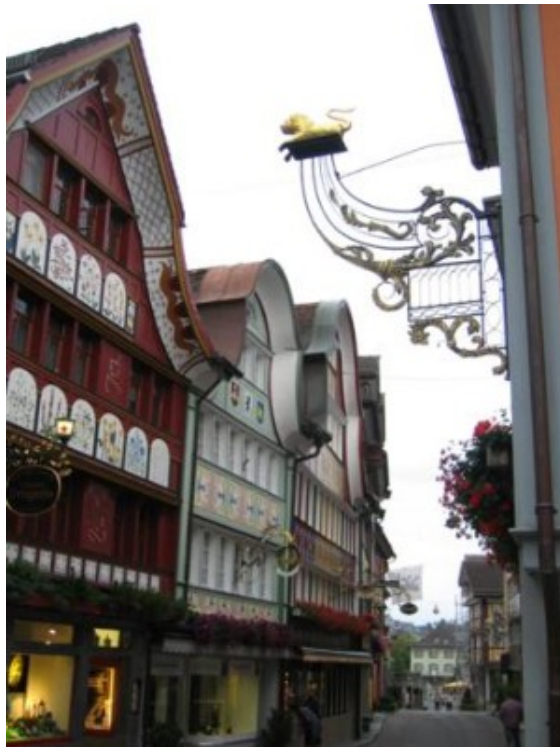
Fachadas pintorescas en Appenzell

Además de por su queso de fuerte sabor, Appenzell es famosa por sus originales y coloridas fachadas. No os engaños, Appenzell no tiene parangón en todo el país. No hay otro pueblo igual. Una auténtica pasada y si os lo perdéis sería una pena. Lástima que el comercio ya estuviese cerrado a esas horas de la tarde, gajes del oficio en un país que cierra tan pronto, pero aún así tiene escaparates muy, muy bonitos.