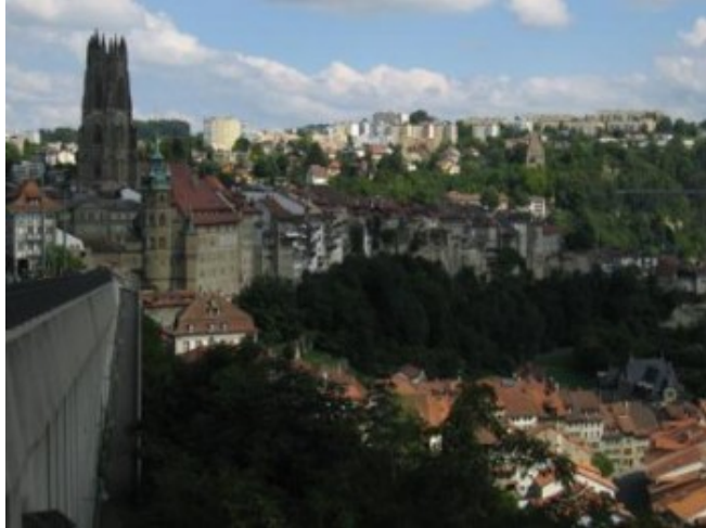
Fribourg. La haute y la basse ville