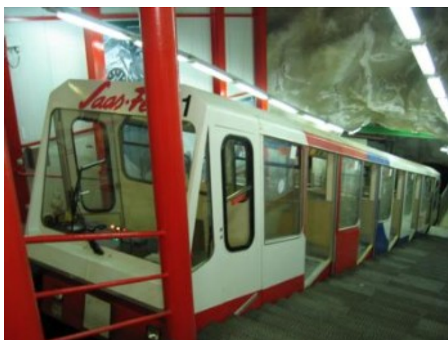
El metro alpino

Subir hasta el “palacio de hielo,” excavado en pleno glaciar, supone tomar dos teleféricos y, por último, el único “metro alpino” que existe en el mundo, el “Alpin-Express, que asciende por el interior de la montaña en un trayecto de cuatro minutos de duración. La entrada al palacio de hielo es gratuita, incluida en el billete de funicular.