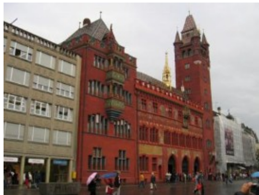
Basel. El Ayuntamiento

Tras la "visita panorámica" del Emmental por carreteras secundarias, salimos nuevamente a la autopista A1 con intención de pasar la tarde en Basel/Basilea . Lamentablemente la lluvia volvió a aparecer y eso deslució bastante la visita, pero creo que si vais escasos de tiempo, no sufráis si decidís no ir.