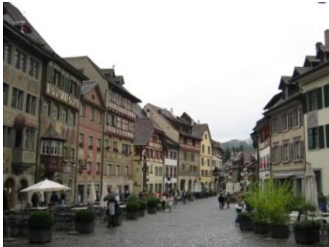
La pintoresca Schaffhausen

El domingo estaba reservado a recorrer el margen norteño de Suiza, siguiendo la ruta del Rin: Schaffhausen y las cascadas del Rin, Stein am Rhein y Konstanz . Si el sábado había llovido poco, el domingo fue peor. Nos detuvimos de nuevo en St.Gallen para visitar la preciosa “Stiftbibliothek”, la fantástica biblioteca de la abadía. Es mucho más pequeña de lo que se pueda pensar, pero la decoración barroca y las tallas de madera son una pasada. Visita muy recomendable, en la que incluso podremos ver un sarcófago egipcio. Para no dañar el suelo de madera, se entra con unas zapatillas que te pones en la entrada.