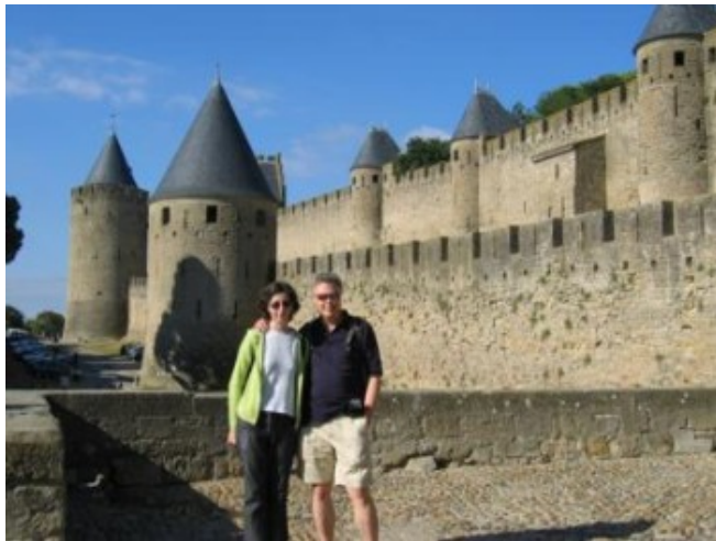
En las murallas de Carcassonne

Carcassonne es una maravilla. Puede que más por sus murallas y torreones perfectamente conservados que por sus callejuelas, un poco sosas quizás. Vamos, que gusta más por fuera que por dentro.