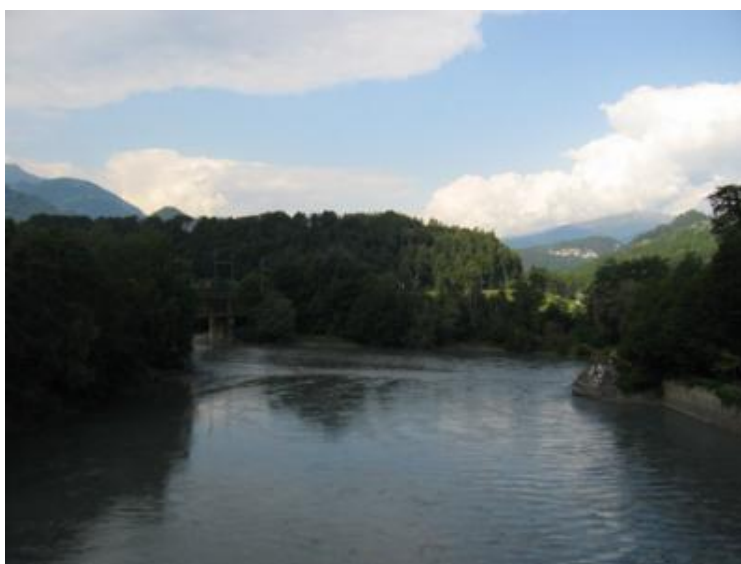
Reichenau: la unión del Rin Anterior y Posterior

El otro brazo, el Vorderrhein o Rin Anterior, es el que nace en Andermatt. Ambos ramales confluyen en Reichenau . Me confieso un enamorado del Rin y me hacía mucha ilusión contemplar la “y griega” donde realmente “nace” el río, pues desde ese punto pasa a llamarse Rin o Rhein, en alemán. Si queréis ver el lugar exacto, hay que dejar el vehículo en el parking de la estación de tren de Reichenau, fuera de la localidad, y andar unos doscientos de metros hasta el puente sobre la carretera. Desde allí veréis “el nacimiento del Rin”. No os perdáis el relato del Viaje del Rin desde su nacimiento hasta su desembocadura.