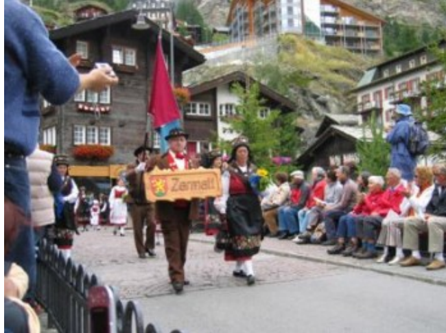
Romería en Zermatt