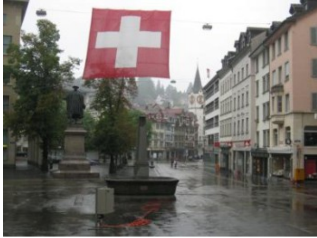
Lluvia en Sankt Gallen

Además de por su queso de fuerte sabor, Appenzell es famosa por sus originales y coloridas fachadas. No os engaños, Appenzell no tiene parangón en todo el país. No hay otro pueblo igual. Una auténtica pasada y si os lo perdéis sería una pena. Lástima que el comercio ya estuviese cerrado a esas horas de la tarde, gajes del oficio en un país que cierra tan pronto, pero aún así tiene escaparates muy, muy bonitos.