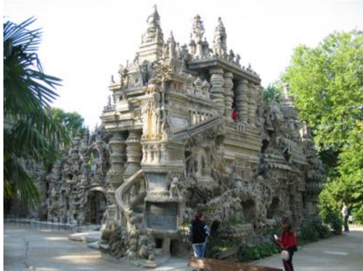
Una obra impresionante...

Un cartero del pueblo, Ferdinand Cheval, durante 33 años -desde 1879 a 1912- edificó piedra a piedra y a base de esfuerzo y tesón, la filigrana con pinta de palacio oriental que ahora podemos visitar, alucinando a cada paso. Cuando lo acabó, aún le quedaban ganas de seguir dando el callo y en ocho años más se construyó asimismo su propio panteón, que también puede visitarse en el cementerio del pueblo.