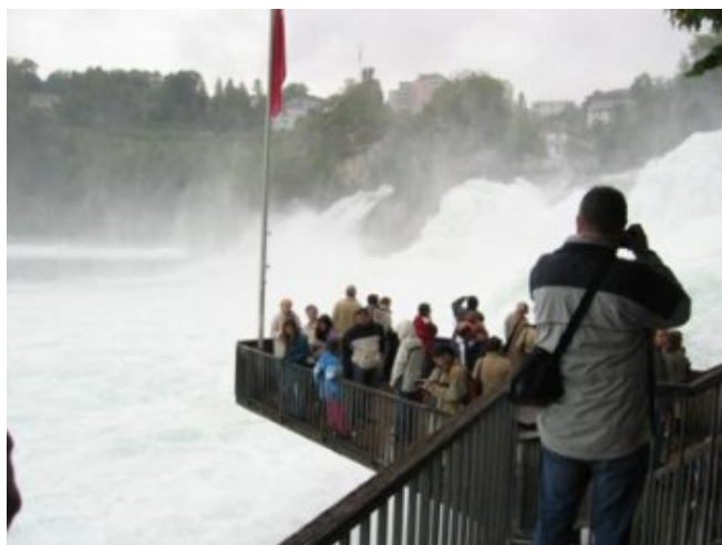
Las famosas cataratas del Rin - Schaffhausen

La siguiente parada, siempre bajo una fina lluvia, fueron las espectaculares cascadas del Rin , en las proximidades de Schaffhausen. Hay grandes aparcamientos alrededor, aunque siempre muy llenos. Se paga un franco suizo para entrar en el recinto, a través del Castillo de Laufen, y el camino, plagado de escaleras y miradores, desciende hasta prácticamente a pie de cascada. “Impresionante”, en dos palabras. El estruendo del agua es tremendo. Desde luego es muy bonita y espectacular, mucho más de lo que yo imaginaba, lo que siempre es de agradecer.