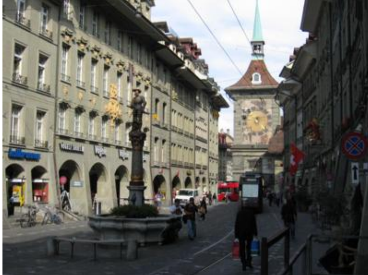
Los soportales berneses y el Zeitglockenturm

A las horas en punto, en la famosa torre del reloj de la ciudad, la Zeitglockenturm, y como buenos “guiris” vimos moverse las figuritas que tanta expectación despiertan. Otra atracción muy divertida es el foso de los osos, animal-símbolo de Berna, que hay en pleno centro urbano. La gente se arremolina alrededor del foso, mientras los descarados osos pardos “se esfuerzan” en pedir los trozos de fruta que se compran allí mismo a los visitantes y que es la única comida autorizada que se les puede dar. Es muy, muy divertido.