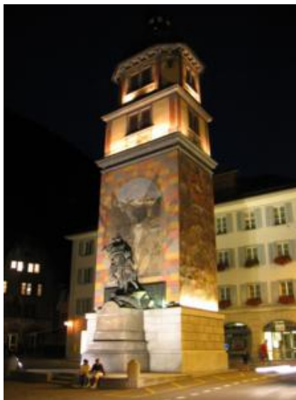
Estatua de Guillermo Tell

Altdorf apenas tiene interés turístico, con excepción del monumento a Guillermo Tell y su hijo, junto a una torre decorada con escenas del famoso flechazo a la manzana.