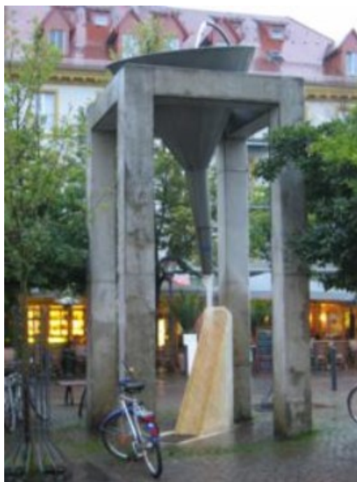
Konstanz: monumento al embudo

Terminamos el día, sin lluvia, en la ciudad suizo-alemana de Konstanz. “La parte suiza” se denomina Kreuzlingen y los pasos fronterizos están por toda la ciudad. No obstante el interés turístico está en Konstanz, ciudad que, por su proximidad a la neutral Helvecia, se libró de los bombardeos de la Segunda Guerra Mundial, por lo que su patrimonio arquitectónico está intacto.