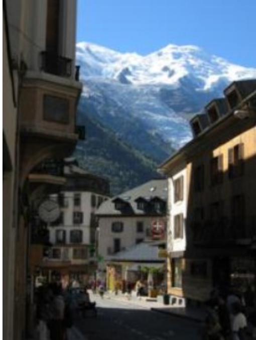
Chamonix y el Montblanc

Sus calles, sus casas de madera, el espectacular e impresionante entorno alpino, gracias a las “agujas” y, sobre todo, al majestuoso Montblanc, que brillaba bajo el sol. En las afueras del pueblo, en la Escuela de Ski, hay un aparcamiento gratuito y apto para autocares y caravanas. Allí la dejamos unas horas. La zona es maravillosa y merece dedicarle varios días, pero dadas las circunstancias nos conformamos con darle una vuelta. ¡Ya volveremos en otra ocasión con más tiempo!.