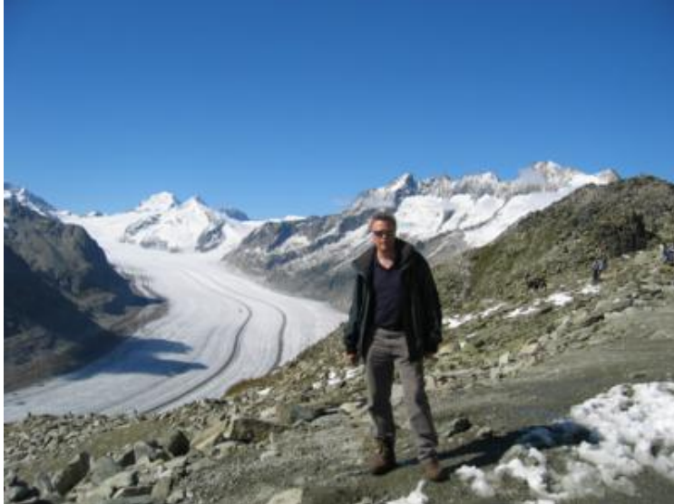
El río de hielo desde Eggishorn

Los dos teleféricos costaron 42,80 CHF/adulto. No obstante, gracias a la tarjeta de descuento para los teleféricos de la zona que nos dieron en el camping, nos ahorramos un 20% en la tarifa, lo que estuvo genial, (Saas Fee no está incluido).