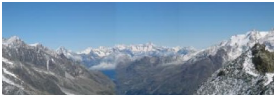
El Saastal, el valle de Saas. Suiza en estado puro.

regaló un día de postal. ¡Ni una nube en el horizonte!. Vamos, perfecto para gozar las cumbres alpinas.