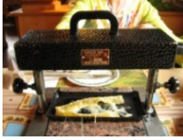
Fundiendo el queso