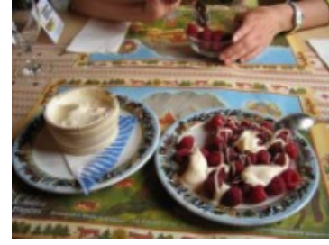
Las frambuesas con nata

A las 12, 15 h. salimos rumbo al valle de Emmen o Emmental , famoso también por su queso de agujeros. ¡Era el día del queso, estaba visto! El valle está al lado mismo de Berna y su mayor atractivo son las espectaculares granjas de madera, con techo a dos aguas que casi toca el suelo y las fachadas llenas de flores. Praderas verdes, suavemente onduladas, llenas de vaquitas. Suiza en estado puro, vamos. Más que los pueblos, es la zona la que resulta interesante.