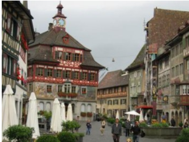
La aún más pintoresca Stein am Rhein

Lástima de la lluvia que lo desluce todo, porque la ciudad es preciosa, claro que Stein am Rhein le gana claramente la partida. Mucho más pequeña, con más encanto, “más sabor” y a orillas del mismo Rin, como indica su nombre. Visita imprescindible de todo punto. Un perfecto y maravilloso pueblo medieval.