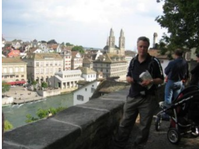
Vistas de Zurich...

El ayuntamiento del s. XVII, junto a las casas gremiales, se encuentra a orillas del río. Interesante es también la Bahnhofstrasse, la principal arteria de la ciudad, repleta de árboles, bancos (con sus famosas cajas fuertes subterráneas) y tranvías. Si St.Gallen estaba llena de figuras de osos pintados de colores, en Zürich eran ratones decorados de mil maneras. Un concurso entre comerciantes que da mucha vistosidad a las calles. Un día es tiempo más que suficiente para patear los puntos de interés.