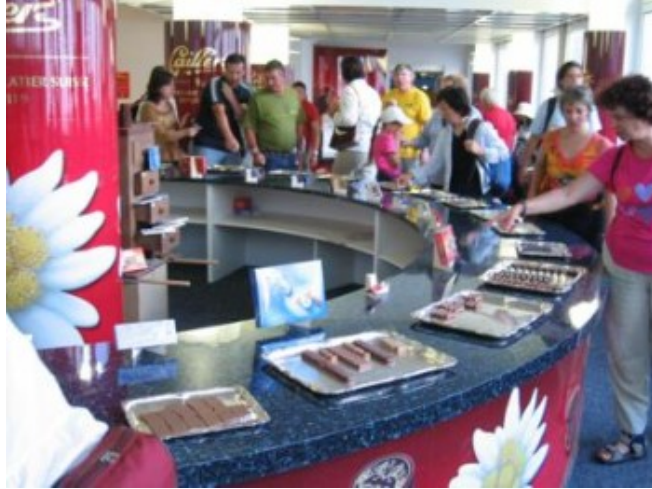
La degustación de bombones...