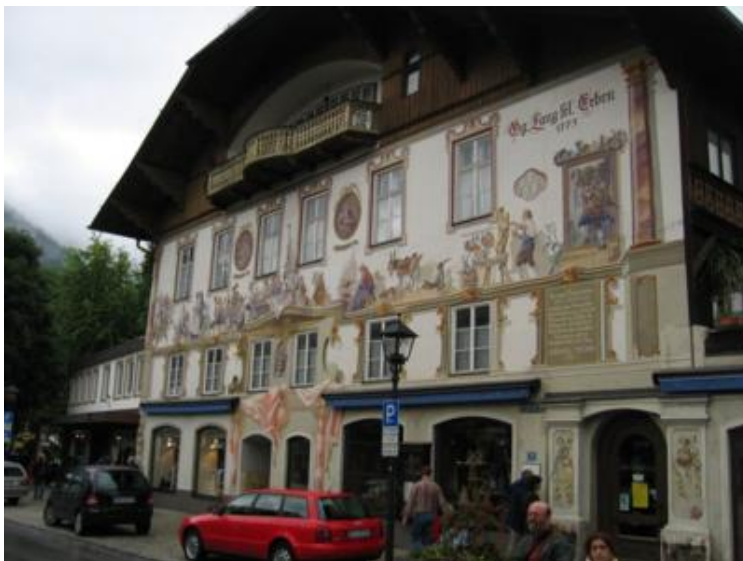
Fachadas decoradas en Oberammergau. ¡Fantásticas!

Y si ganas tenía de ver la Wieskirche, más aún me apetecía pasear por Oberammergau . ¡Qué virguería de pueblo!. Casi todas las casas tienen los frontales pintados con escenas pintorescas y con las ventanas llenas de flores, aunque muy diferentes a las de Schaffhausen y Stein am Rhein, como ya hemos comentado. Un regalo para la vista.