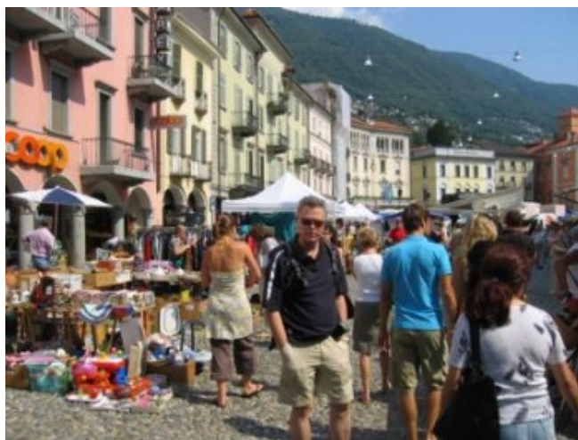
Mercadillo en Locarno

El jueves era día de mercado en Locarno (de 9 a 17 h. en la Piazza Grande). Un mercadillo de cachivaches, muy animado, con puestos de comida y donde encontré un LP al que hacía mucho tiempo que le iba detrás. Creo que fue el mejor recuerdo de la ciudad, pues la verdad es que nos pareció bastante cutre.