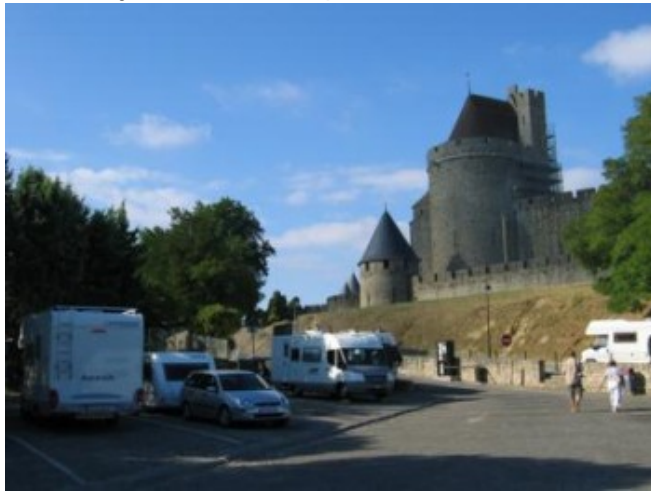
El parking de caravanas de Carcassonne

libres ya escaseaban, claro que, por si acaso, en Carcassonne hay también un buen camping donde intentar dejar la caravana por unas horas.