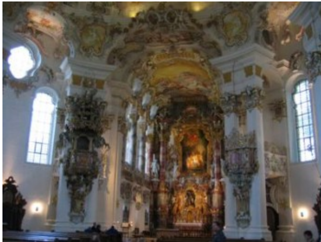
La suntuosidad barroca de la Wieskirche

La primera parada del día fue la Wieskirche , iglesia situada en mitad de un prado y cuyo anodino exterior no deja entrever el festival barroco llevado hasta sus últimas consecuencias que encontraréis en cuanto crucéis la puerta. El aparcamiento es apto para caravanas.