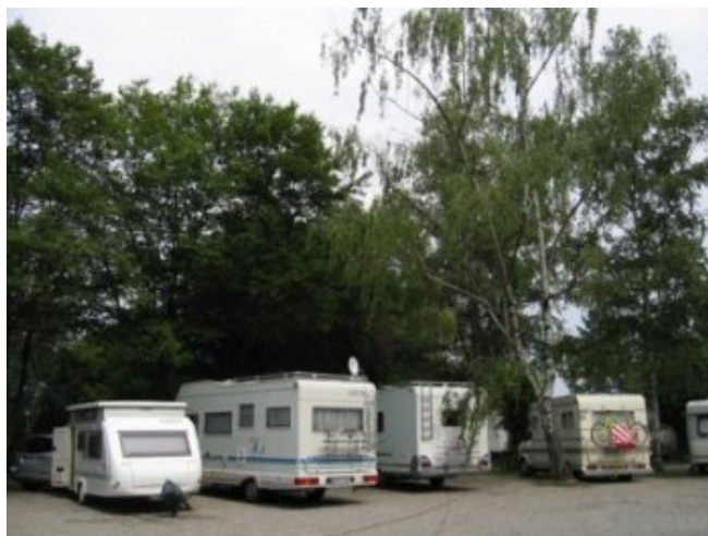
"Estabulados" en el camping de Zurich-Seebucht

Si hubiese sido por ganas, me hubiese ido inmediatamente de ese camping, pero a las 11,30 h. y por una sola noche, pensé que iba a poder resistirlo. Y esa impresión la compartíamos todos. Carísimo, malo, con recepcionista antipático y, para colmo, con la obligación de dejar el coche en el parking. Y son inflexibles en esas cosas, vamos, muy suizo todo.