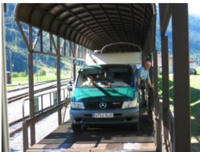
En el tren del Furkapass

El miércoles nos trasladamos a Altdorf , el pueblo de Guillermo Tell, pero para “pasar al otro lado” de las montañas, primero tenemos que cruzar dos imponentes puertos de montaña, el “Nufenenpass” y el “Furkapass”.