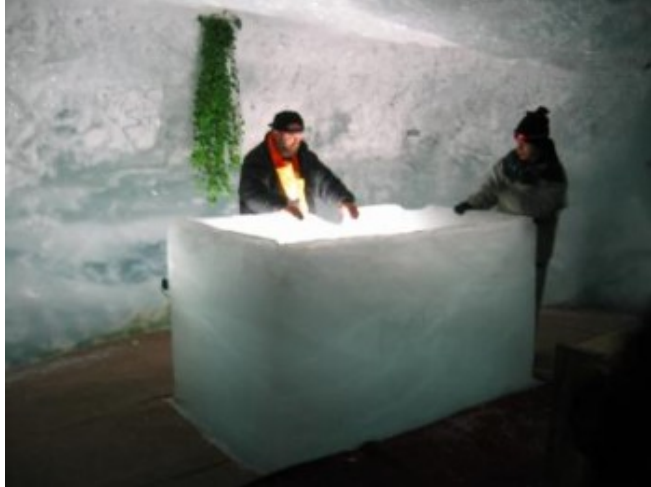
En la cueva de hielo

Cabría preguntarse si, puestos a alcanzar los 3.500 m. de altitud, es mejor elegir el Jungfraujoch (desde Interlaken) o Saas-Fee. Es posible que el ascenso hasta el pabellón “Top of Europe”, donde también hay un palacio de hielo, sea mucho más espectacular que Saas-Fee, pero los más de 125 €, sí de euros, que le cuesta la excursión a cada pasajero puede inclinar decisivamente la balanza hacia Saas Fee, que como habéis visto, mola y mola mucho.